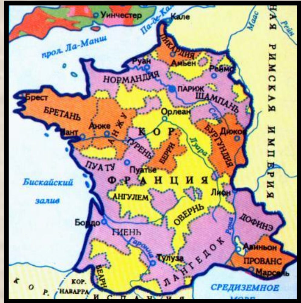
Франция в конце XV в.