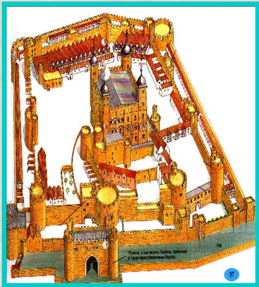
План Тауэра в 17 в.

По окончании войны в Англии началась междоусобица. Две династии Ланкастеры и Йорки вели борьбу за престол.