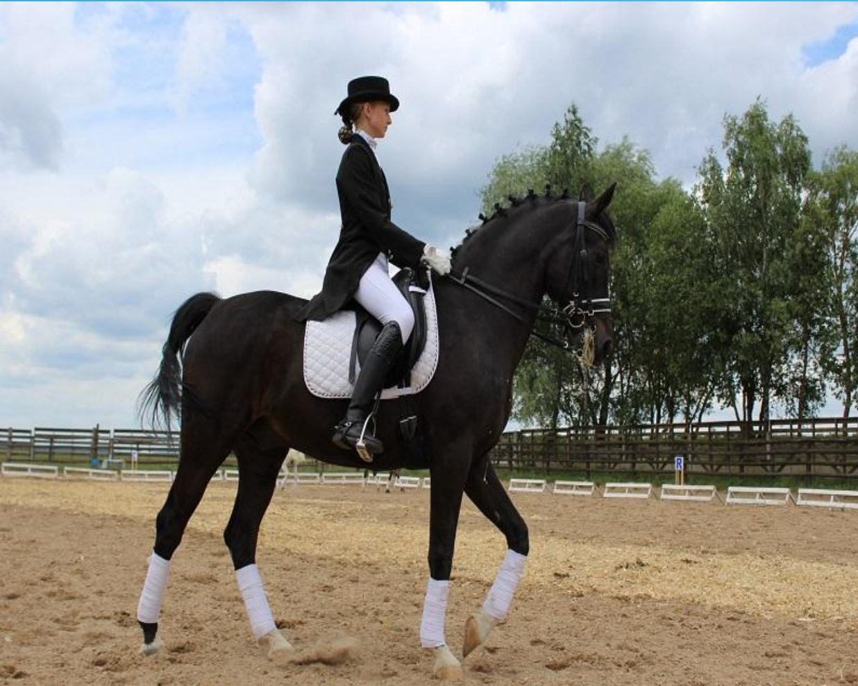
КОЛОС КАРИНА ЛОШАДЬ АДОНИС