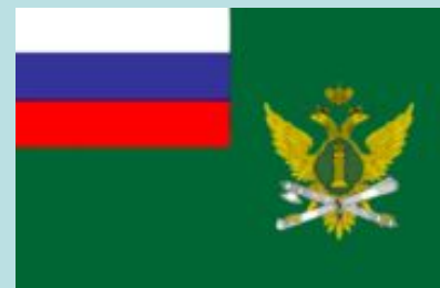
Флаг ФССП России