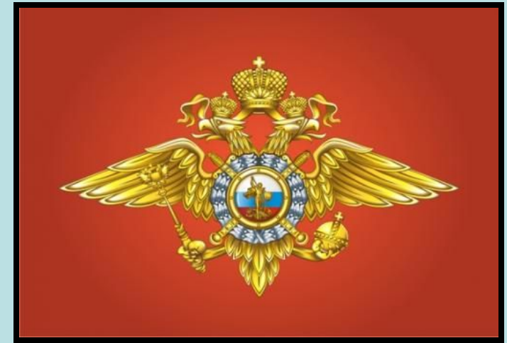
Эмблема МВД РФ

МВД РФ – федеральный орган исполнительной власти, осуществляющий в пределах своих полномочий государственное управление в сфере защиты прав и свобод человека и гражданина, охраны правопорядка, обеспечения общественной безопасности.