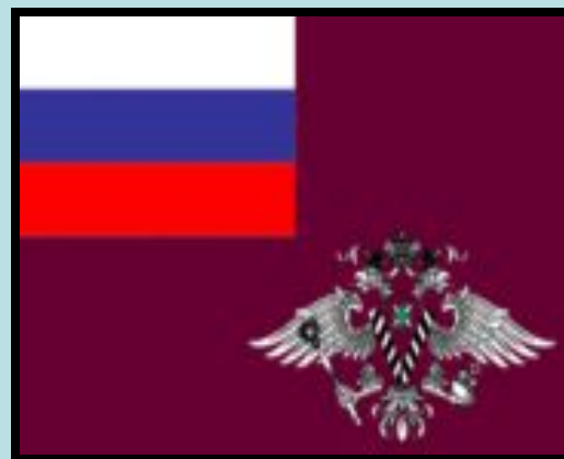
Флаг ФМС России