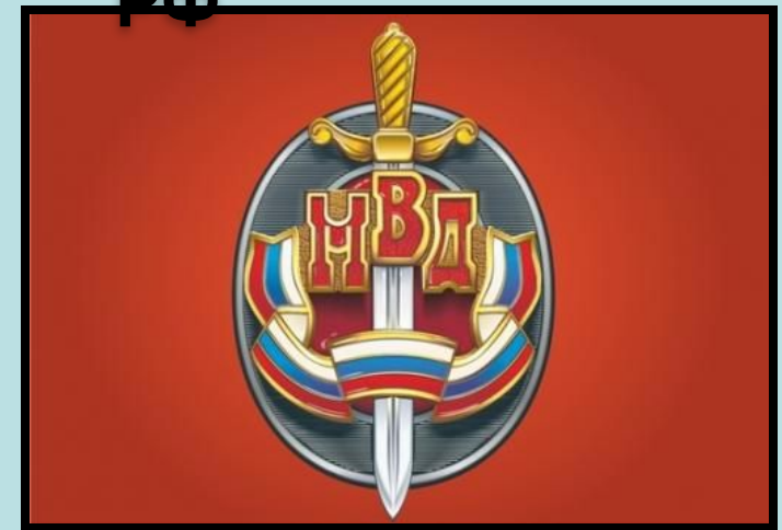
Знак МВД РФ