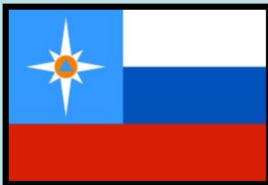
Флаг МЧС России