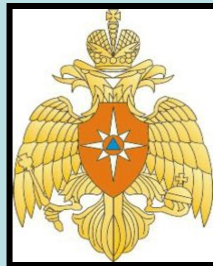
Большая эмблема МЧС России