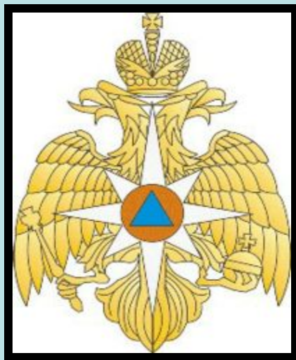
Средняя эмблема МЧС России