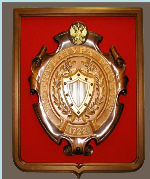
Эмблема Прокуратуры РФ