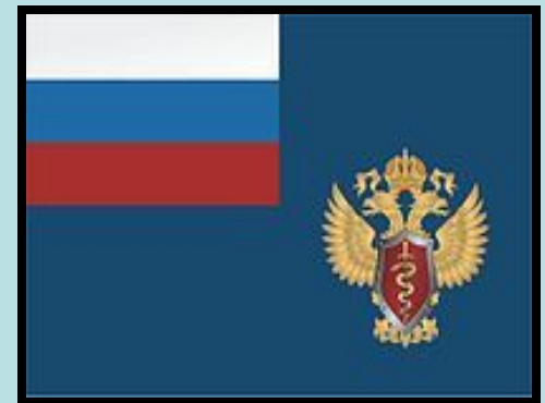
Флаг ФСКН России