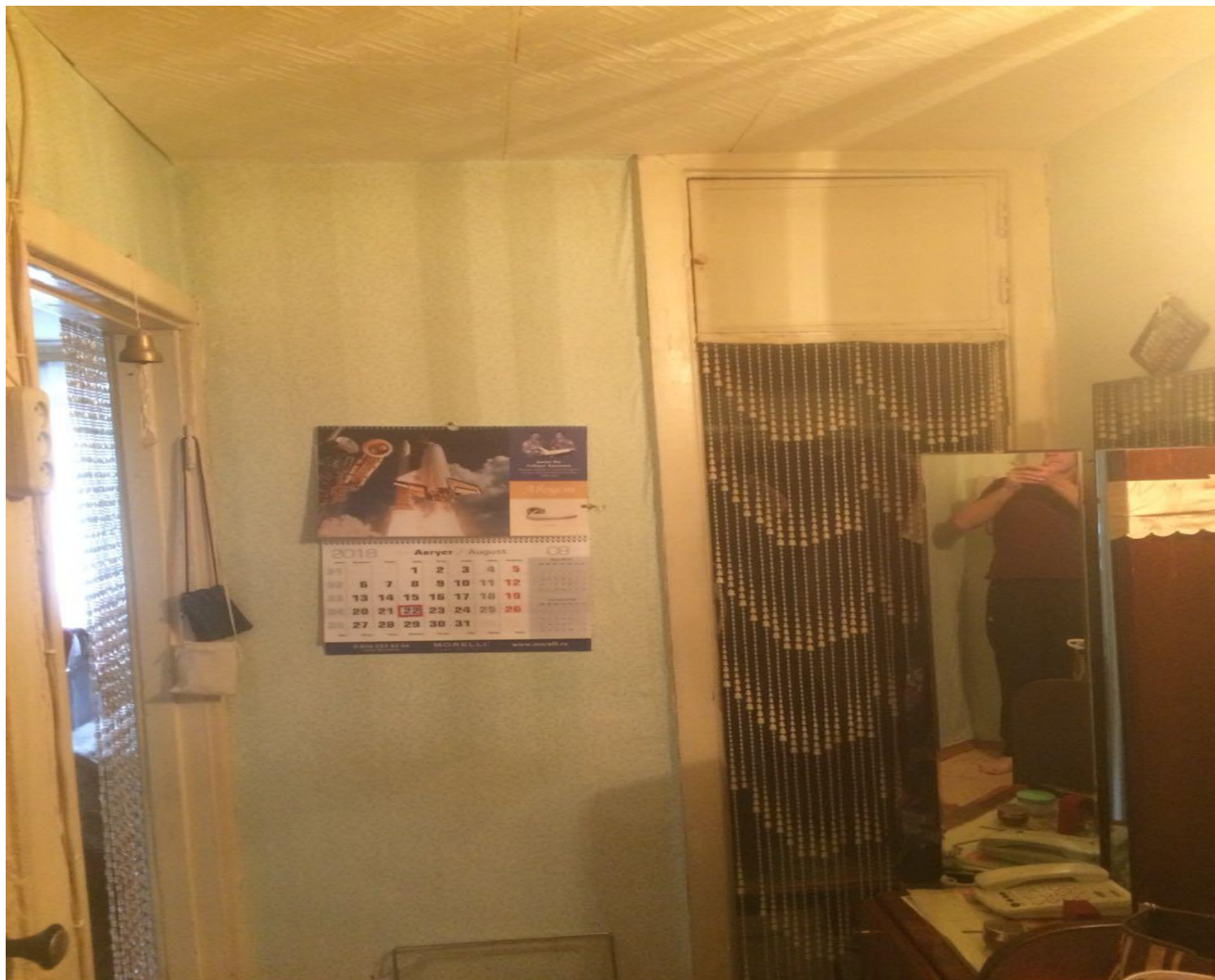
ФОТО ОБЪЕКТА ЗАЛОГА