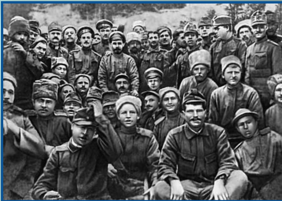
Братание русских и германских войск

Критическим было положение на фронте: нередким явлением стало неподчинение приказу, братание с противником, дезертирство. Немцы захватили Моонзундские острова, оттеснили Балтийский флот в Финский залив. Угроза Петрограду становилась все более реальной.