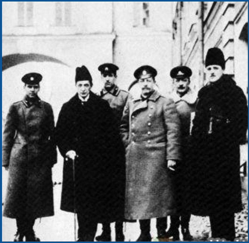
Делегаты Демократического совещания 14 сентября 1917 г.

Предпарламент, который оказался лишь ширмой для прикрытия диктатуры Керенского.