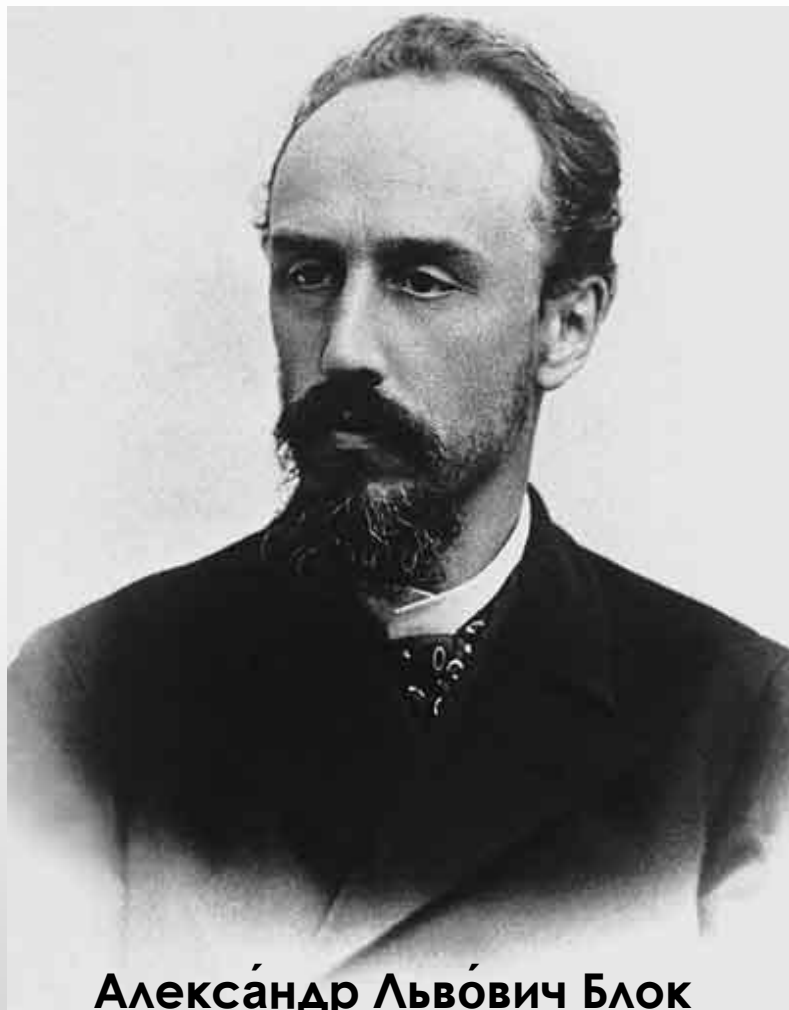
Алекса́ндр Льво́вич Блок