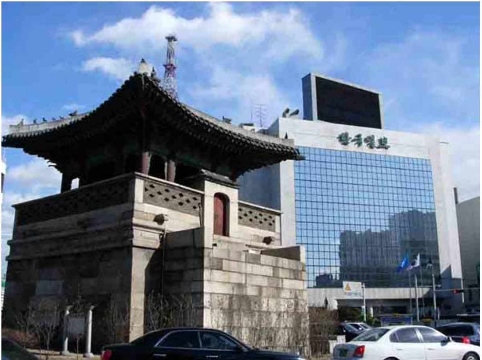
Сеул – столица Республики Кореи