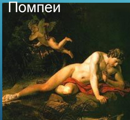
Нарцисс, смотрящий в воду