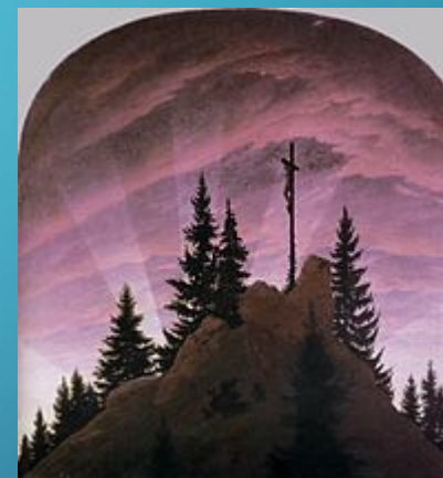
Розп'яття в горах