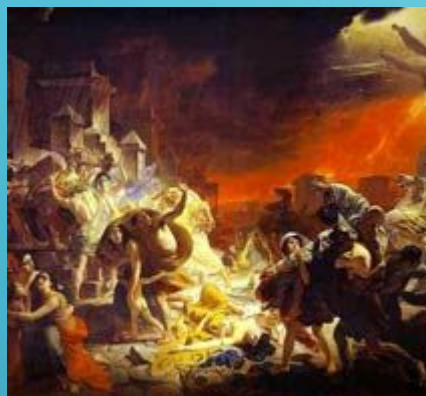
Последний день Помпеи