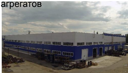
Корпус по ремонту агрегатов