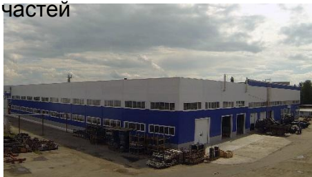
Центральный склад запасных частей