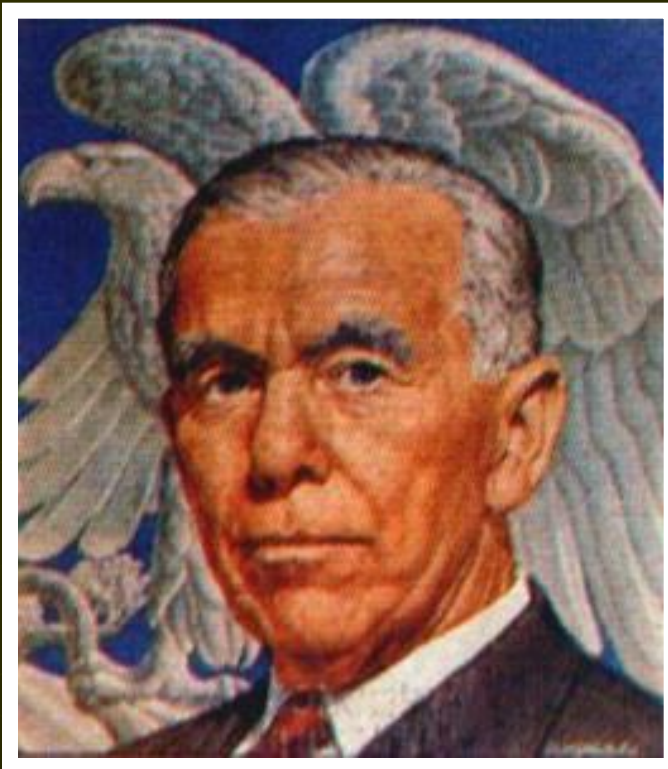
Сенатор Дж. Маршалл

5.3.46 г. Черчилль обвинил СССР в экспансии против «свободного мира» и призвал дать ему отпор.