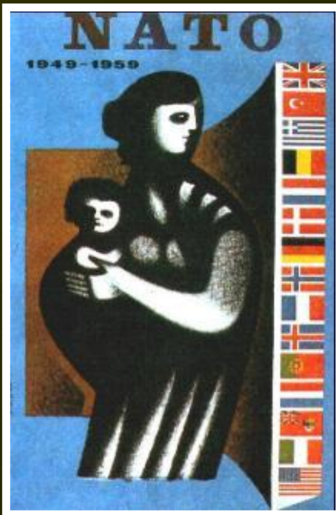
Плакат к 10-летию НАТО

Между союзниками по антигитлеровской коалиции существовали глубокие различия связанные с различными социальными системами. Запад опасался усиления влияния СССР в В. Европе и ЮВА. Борьба между 2 общественно-политическими системами поставила человечество на грань 3 мировой войны. Эта борьба получила название «холодной войны».