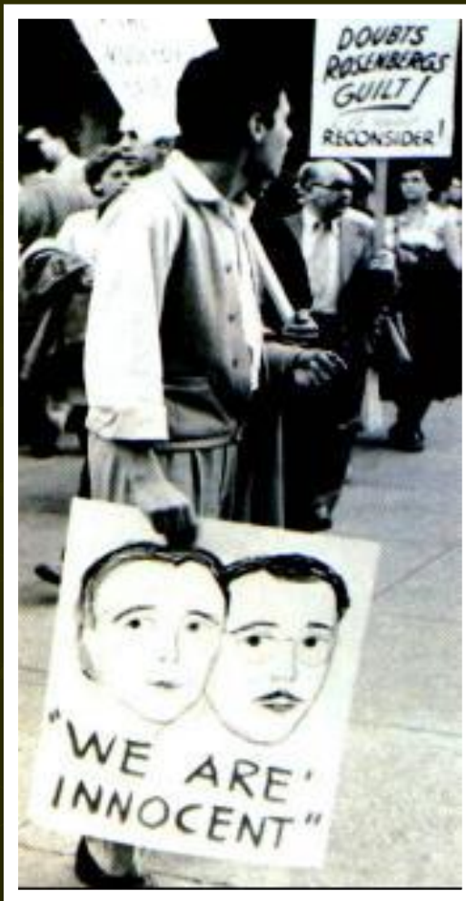
Митинг в защиту Розенбергов

В США началась «охота на ведьм». В первую очередь удар пришелся по евреям.