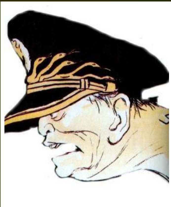
Советская карикатура на И. Броз Тито

В 1947 г. вместо Коминтерна возникло Коминформбюро, координировавшее деятельность компартий. Но в Югославии коммунисты претендовали на самостоятельность. Тито и Г. Димитров без одобрения Сталина договорились о создании федерации балканских народов. Димитров вскоре умер и гнев Сталина обрушился на Тито. В ответ Тито арестовал всех сторонников СССР в своей компартии. Сталин объявил его фашистом.