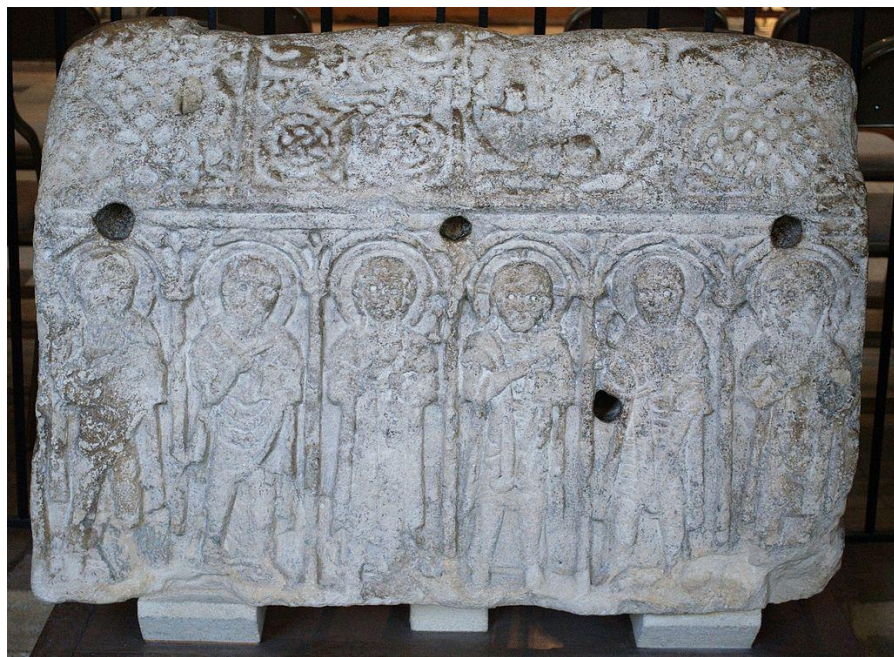
Камень Гедда, редкий пример англосаксонской резьбы по камню 8-го века не с креста.