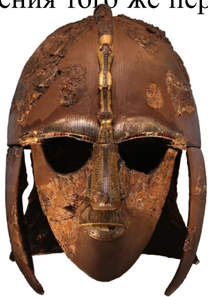
Церемониальный шлем из Саттон-