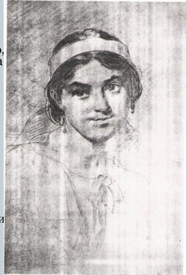
Ликера Полусмакова. Худ. Т. Г. Шевченко. Вугілля, 1860.