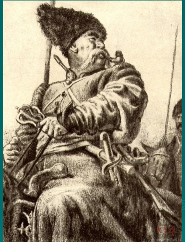
Тарас. Художник Е. Кибрик. 1945

(В светлице все связано с тревожной кочевой жизнью Тараса.)