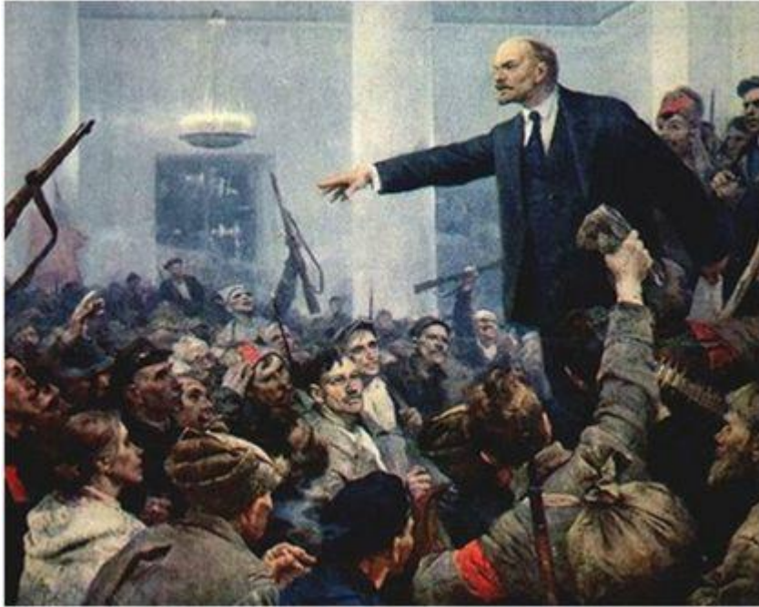
Серов, 1962 Провозглашение Лениным советской власти