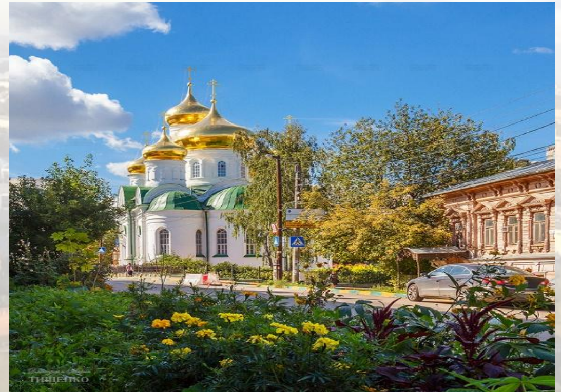
Храм преподобного Сергия Радонежского