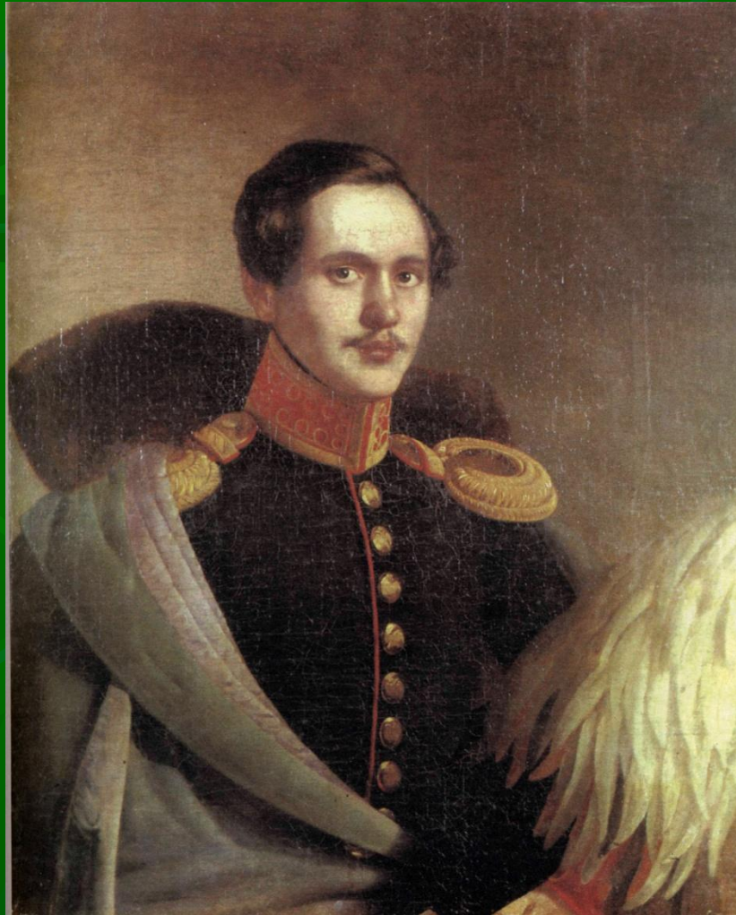
М. Ю. Лермонтов в вицмундире лейб-гвардии Гусарского полка. Портрет работы Ф. О. Будкина. Масло, 1834.