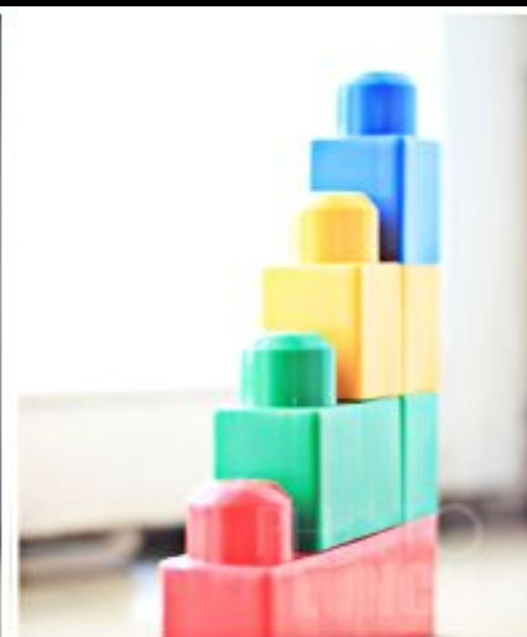
Переэкспонированный кадр EV +2