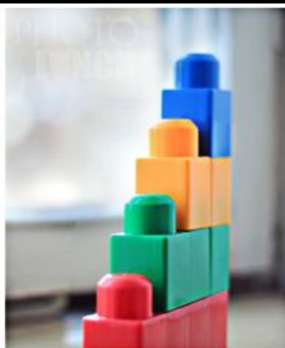
Нормальная экспозиция EV 0