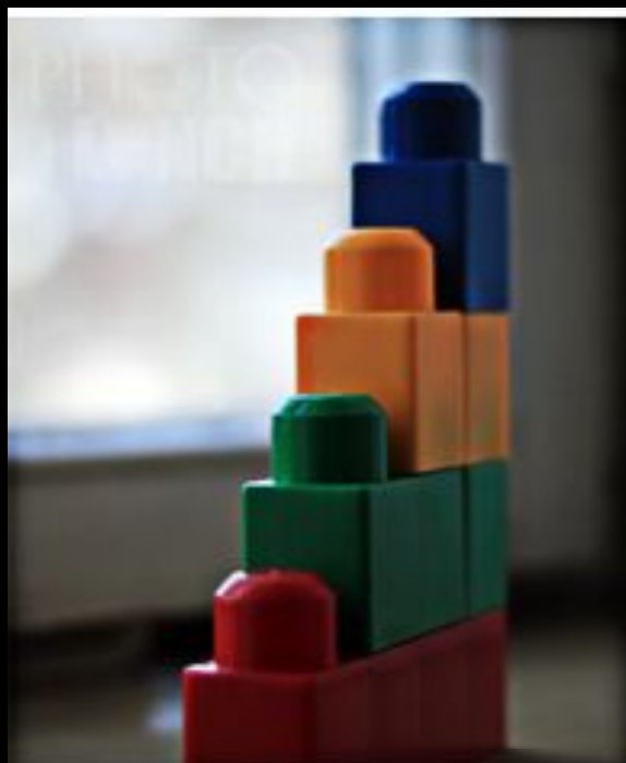
Недозаэкспонированный кадр EV -2