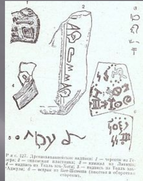
Р и с. 127. Древнеегипетские надписи: 1 — черепок из Гелы; 2 — сибирская пластинка; 3 — клинок из Лакхиа; 4 — надпись из Теэль-эль-Хоси; 5 — надпись из Теэль-эль-Абула; 6 — острак из Бог-Шешта (листая и оборотная стороны).

Согласно одной из самых распространённых теорий, алфавитное письмо зародилось в Египте. Эта теория была предложена Франсуа Ленорманом и изложена Эммануилом де Руже в 1874 году. Как правило, сторонники египетской теории делятся на три группы. Первая группа склоняется к теории, что алфавитное письмо происходит от иероглифического письма. Вторая группа учёных склоняется к версии о происхождении алфавитного письма из иератического письма. Третья теория, соответственно, предполагает происхождение алфавитного письма из демотического