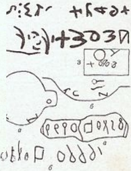
Р и с. 128. Древнеегипетские надписи: 1, 2, 4 и 5 — надписи из Лакхиа (4; 5 — различные варианты); * экспедиция Уэллтона; 3 — знаки, нанесённые краской или вырезанные на камнях из фундамента Перусалинского храма.