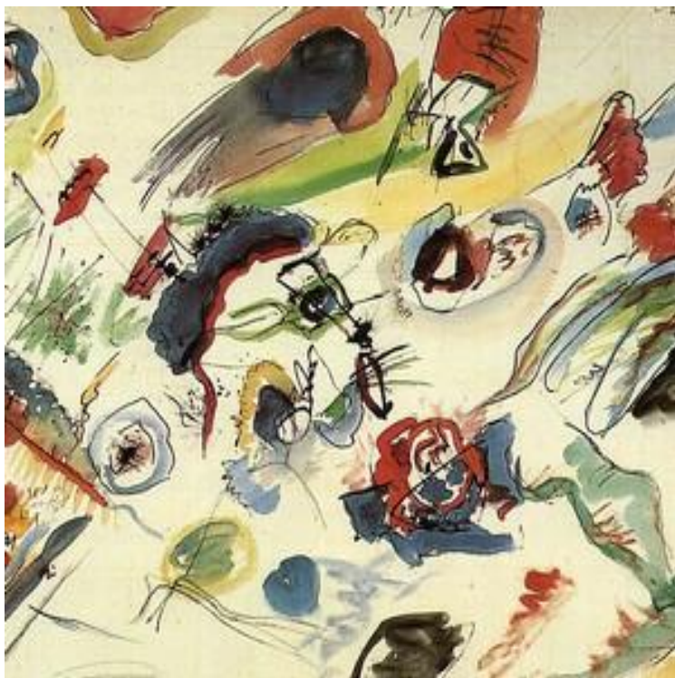
Первая абстрактная акварель