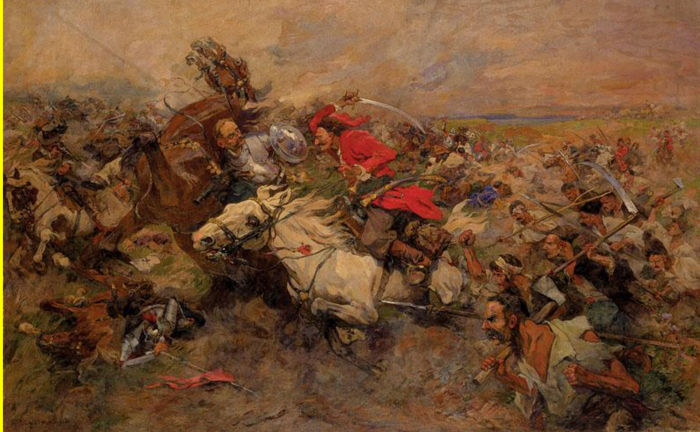
«Бій Максима Кривоноса з Яремою Вишневецьким», 1934р.