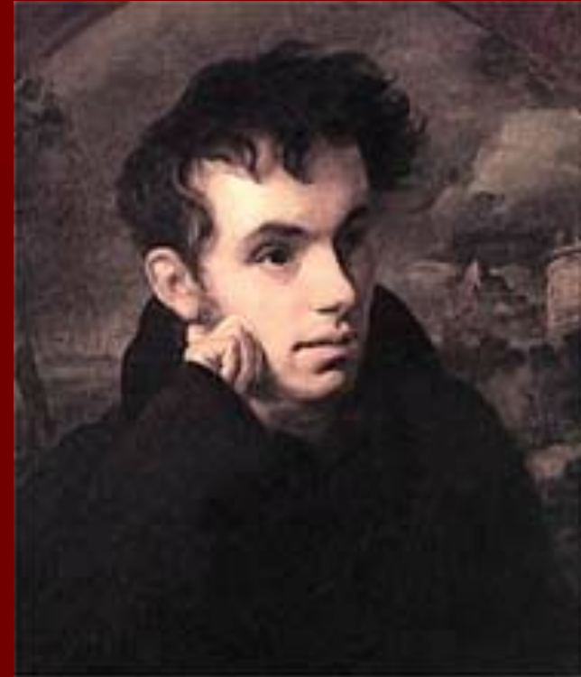
Василий Андреевич Жуковский (1783 – 1852)

немецкий писатель, поэт, основоположник немецкой литературы