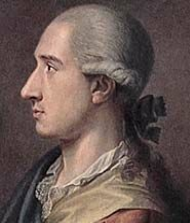
Иоганн Вольфганг Гете (1749 - 1832)

немецкий писатель, поэт, основоположник немецкой литературы