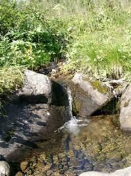
Исток степных рек.