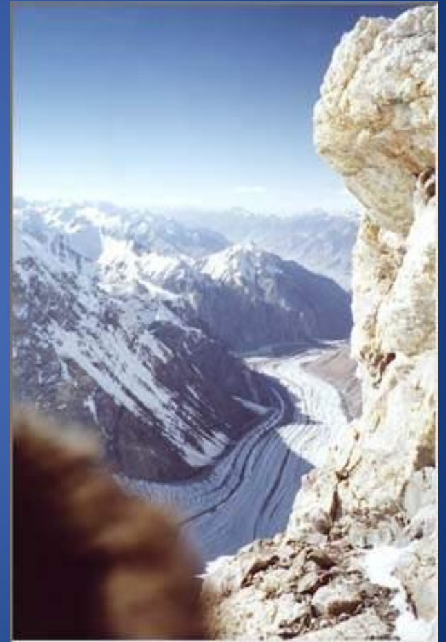
Исток горных рек.