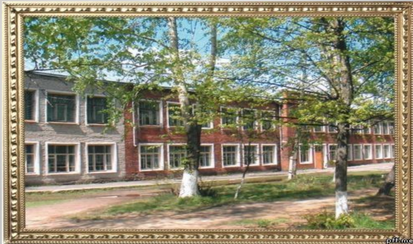
МБОУ «СОШ №4» г. Меленки