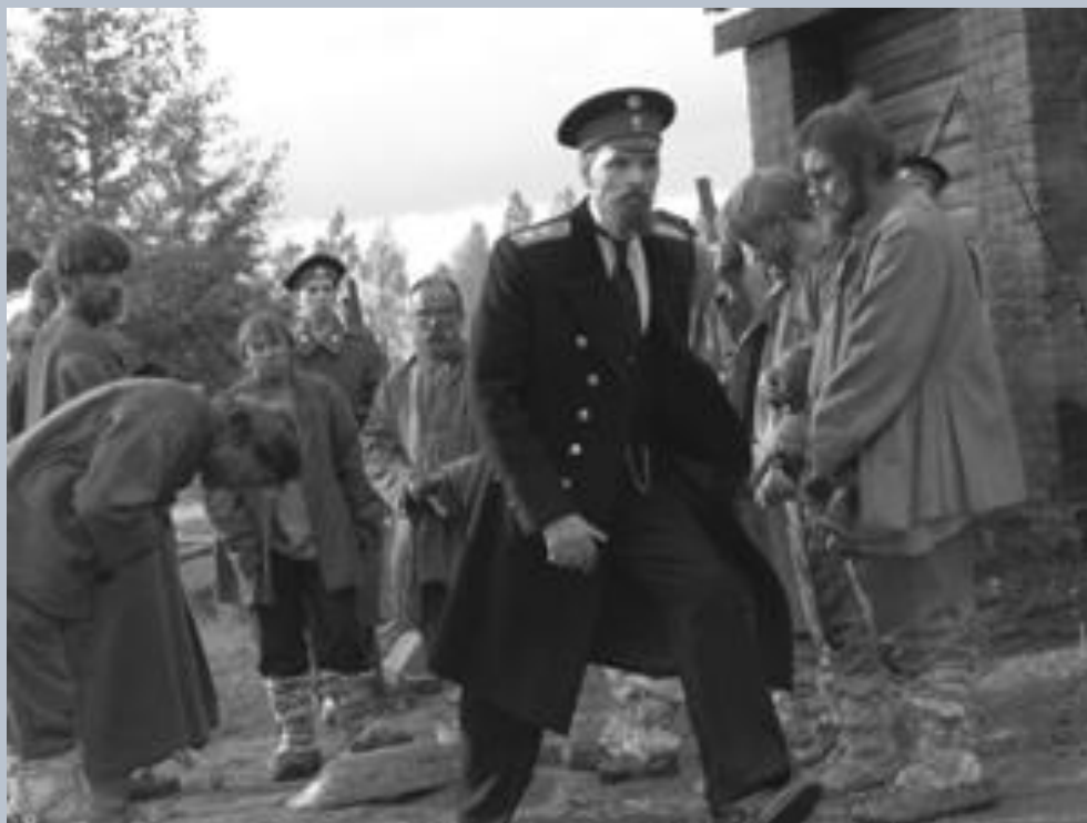
Столыпин осматривает хуторское хозяйство.