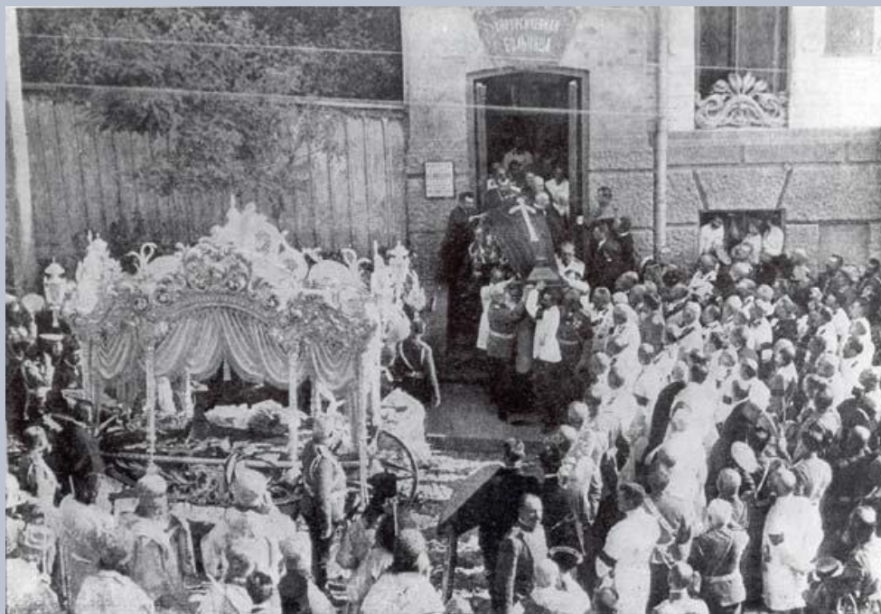
Винось тіла П. А. Столыпина изъ больницы бр. Маковскихъ.