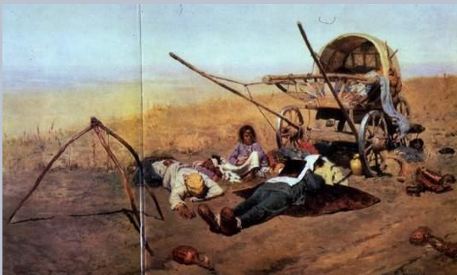
«В дороге...смерть переселенца»