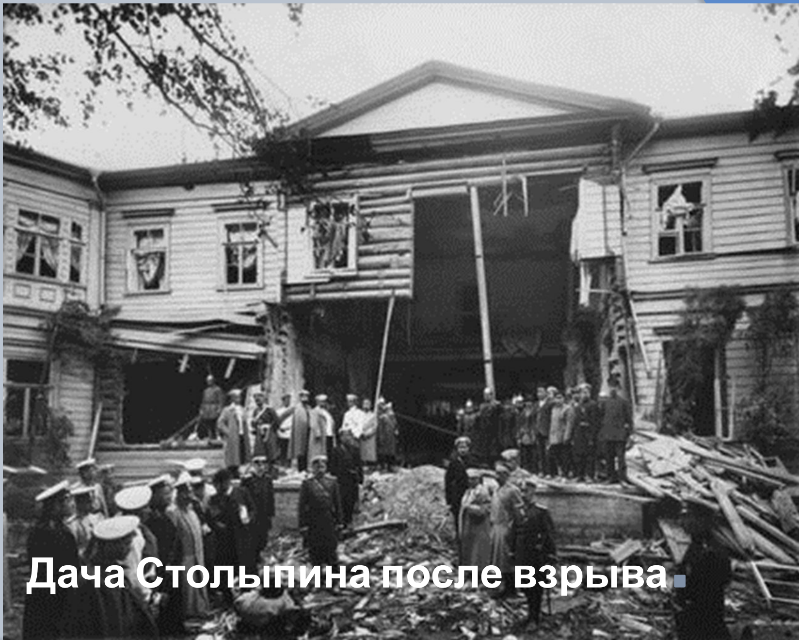
Дача Столыпина после взрыва.