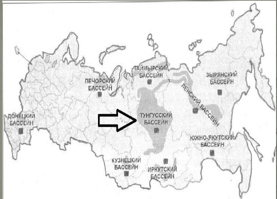
Рис. № 2. Тунгусский угленосный бассейн, на карте России

расположен в Восточной Сибири, районах Красноярского края, Якутии и Иркутской области. Занимает значительную часть Среднесибирского плоскогорья.