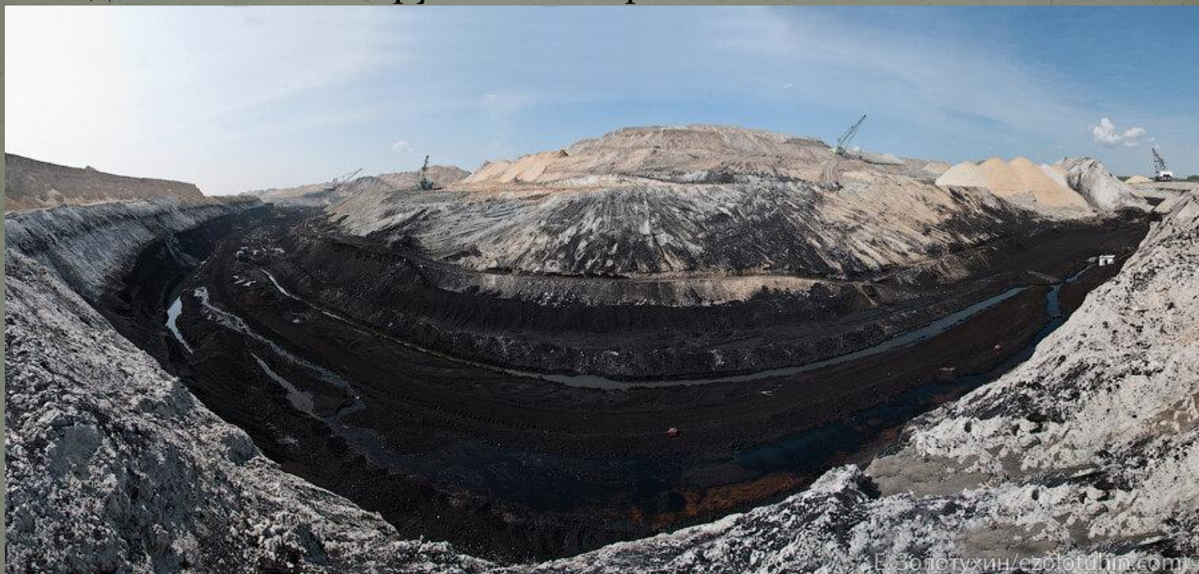
Рис. № 1. Угольный бассейн

В России угольная отрасль хорошо развита и считается одной из самых крупных в мире.