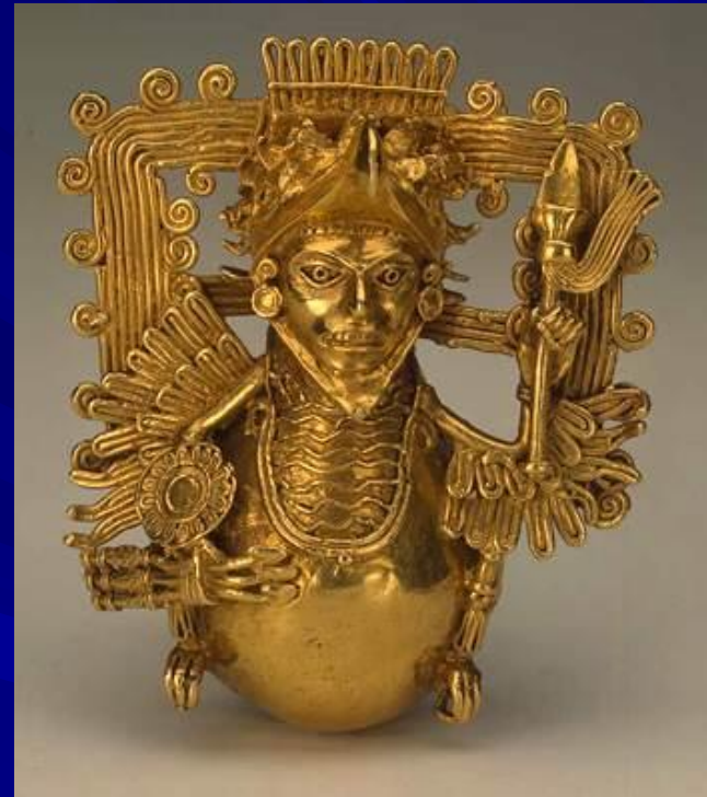
Бубенец в виде «воина-орла». Золото. Ацтеки. Эрмитаж. Санкт-Петербург