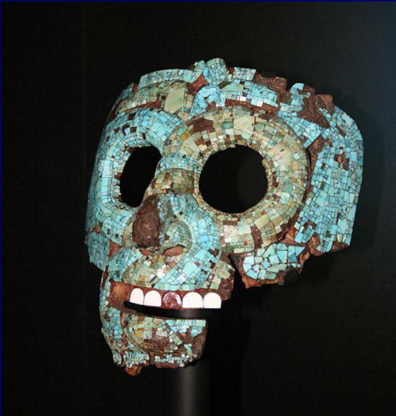
Погребальная маска ацтеков