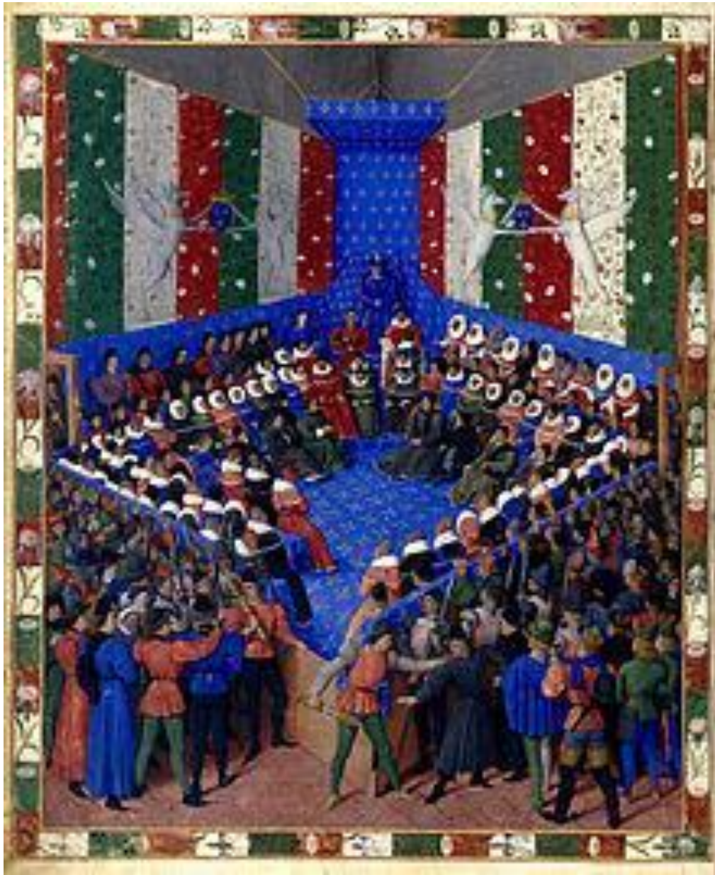
Карл VII, Ложе Правосудия