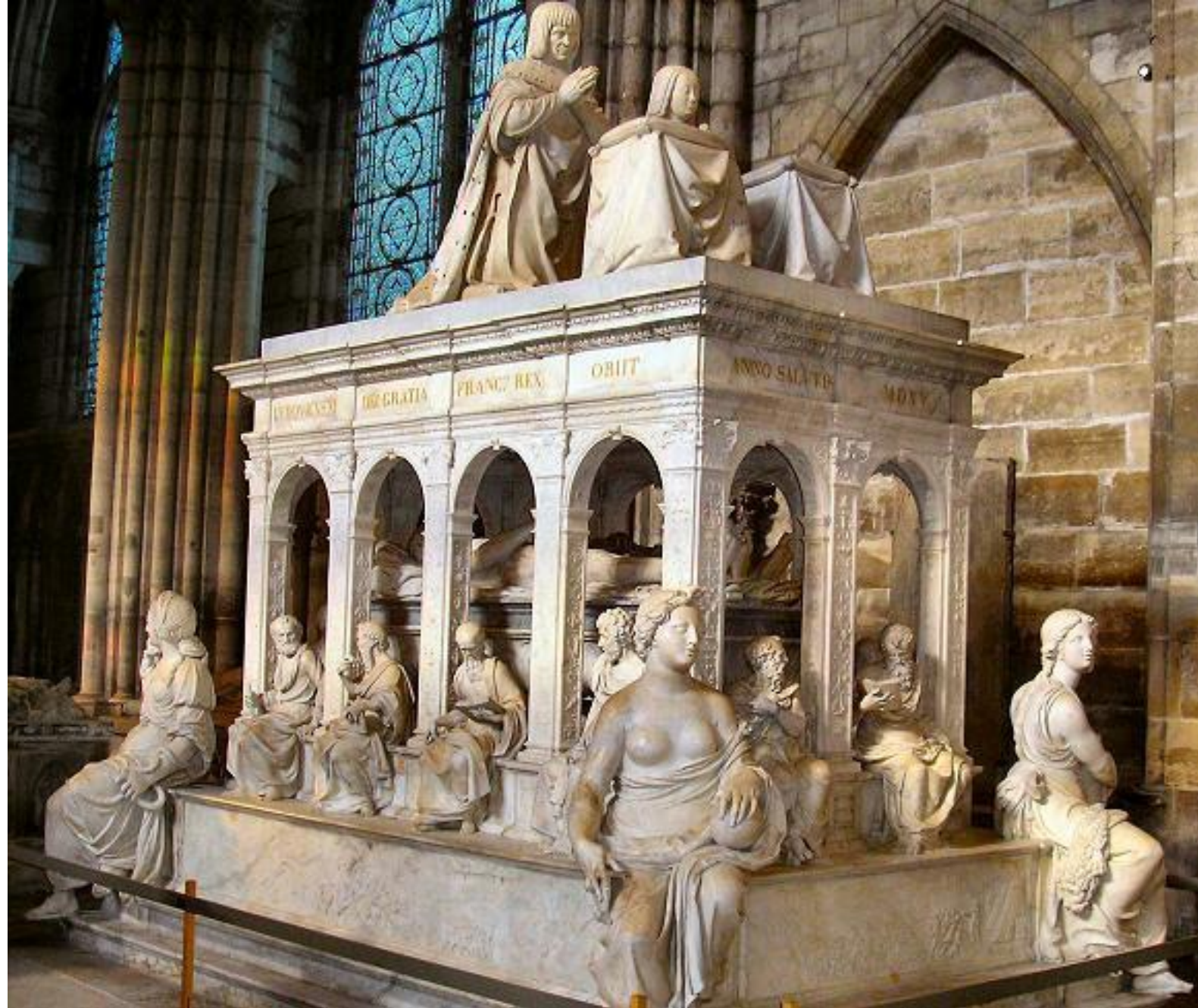
Людовик XII и Анна Бретонская