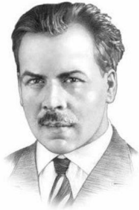
ВАВИЛОВ Николай Иванович 1887-1943

“мне не жалко отдать жизнь ради самого малого в науке”