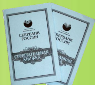
ВКЛАД В БАНКЕ