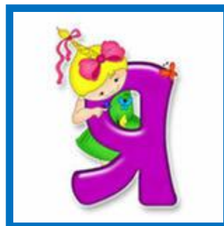
Буква не - А