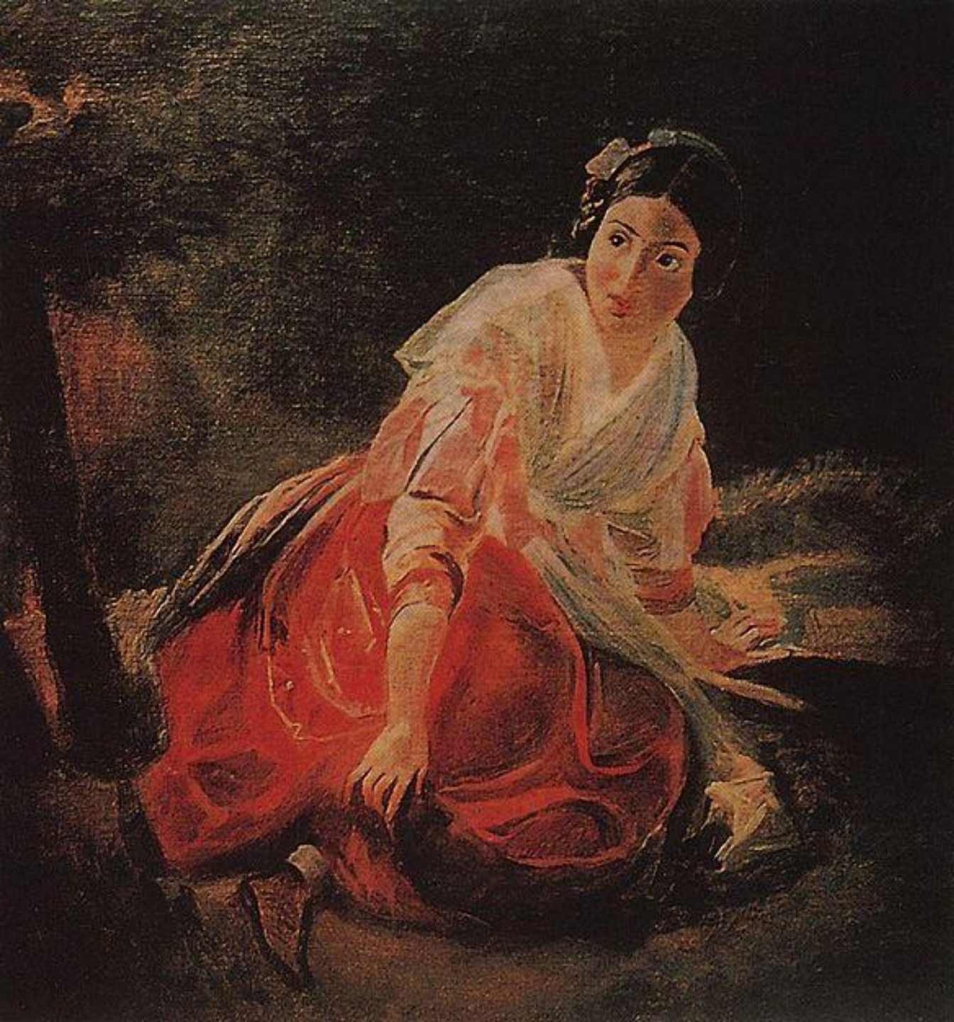
Девушка в лесу 1851—1852