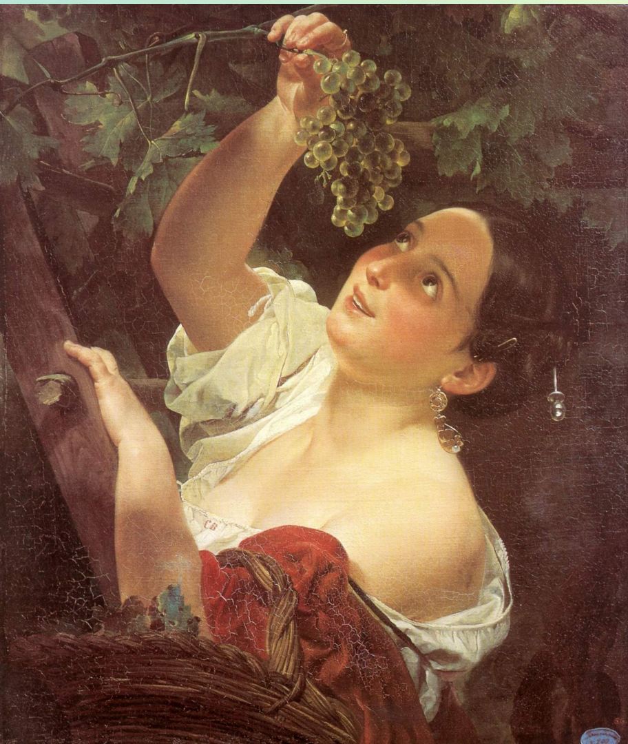
Итальянский полдень (Итальянка, снимающая виноград) 1827

В Академии художеств Карл учился хорошо, и превосходил всех своих товарищей. Учителя удивлялись, как хорошо рисует этот мальчик. Закончив Академию в 1821 с отличием, Брюллов вступил в Общество поощрения художников. Именно благодаря на средства этого общества он отправляется в Италию, настояв чтоб брат Александр, который закончил академию в один год с ним, ехал туда также. Именно к отъезду в Италию Карл Брюллов стал Карлом Брюлловым по настоянию Александра