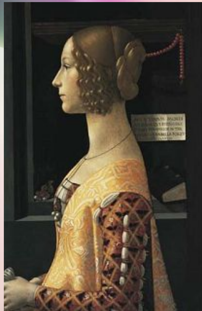
Д. Гирландайо. Портрет Джованны Торнабуони