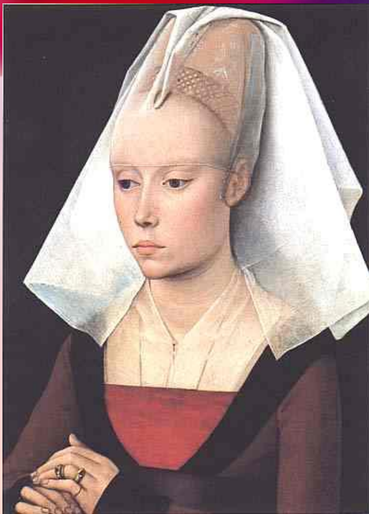
Мастерская Рогира ван дер Вейдена. Портрет богатой женщины. 1465 г.