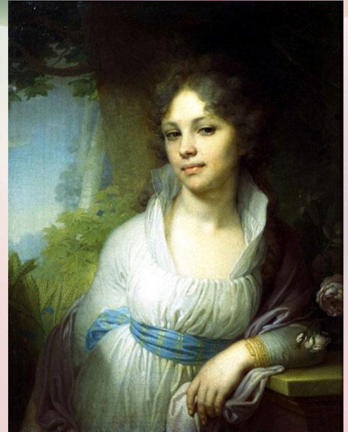
Портрет Марии Лопухиной