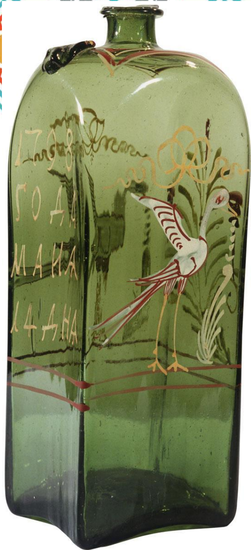
ШТОФ С ИЗОБРАЖЕНИЕМ АИСТА с надписью «1798 года мая 14 дня»