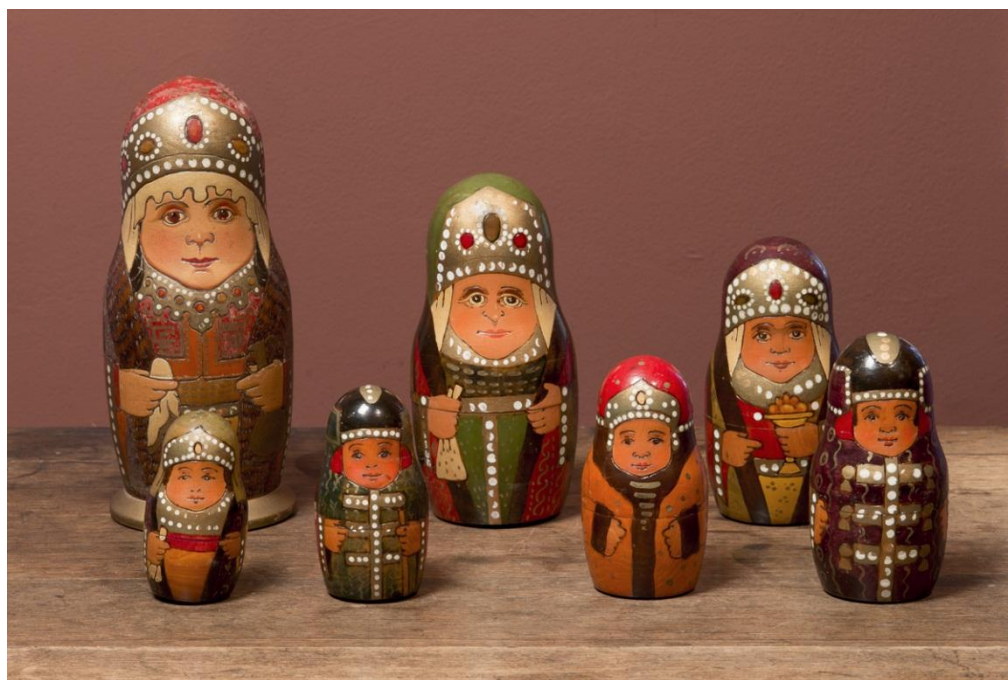
МАТРЁШКА ПЕРВАЯ РАЗЪЁМНАЯ 1930-е гг., Сергиев Посад