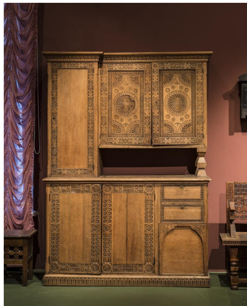
БУФЕТ 1912 г., Москва