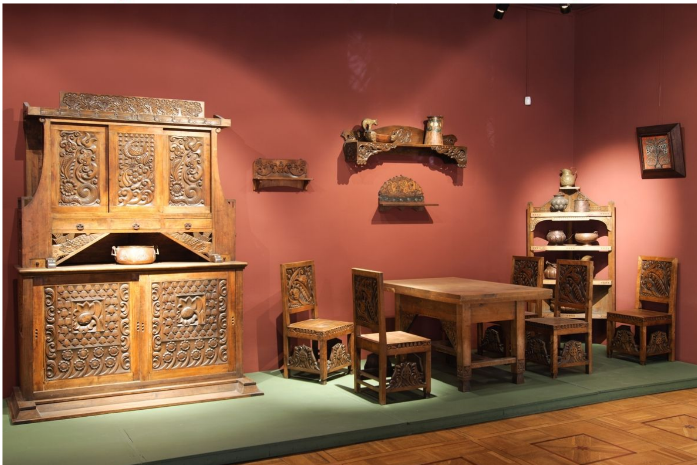
ПРЕДМЕТЫ МЕБЕЛИ ИЗ ГАРНИТУРА СТОЛОВОЙ автор проекта: Малютин С. В. , конец 1900-х гг., Москва