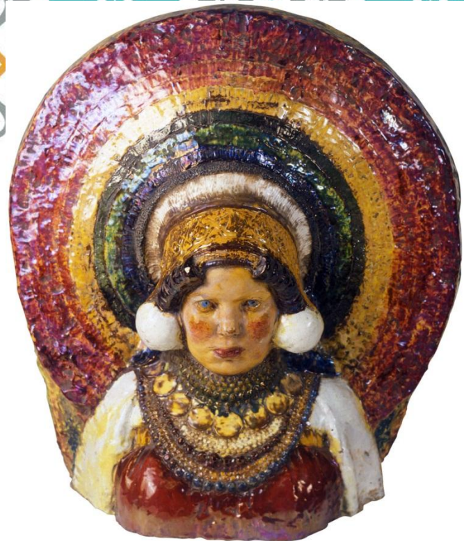
СКУЛЬПТУРА «ТУЛЬСКАЯ КРЕСТЬЯНКА»

1898-1899 гг., Санкт-Петербург. Императорский фарфоровый завод