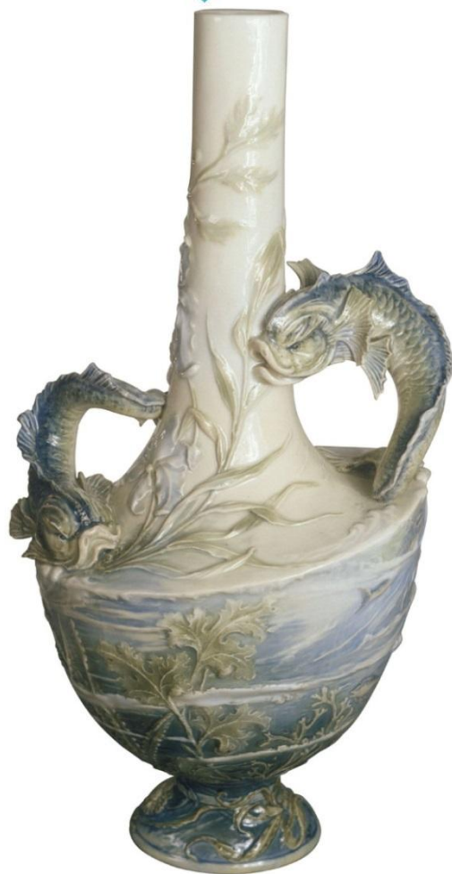
ВАЗА ДЕКОРАТИВНАЯ «ДЕЛЬФИНЫ»

1898-1899 гг., Санкт-Петербург. Императорский фарфоровый завод