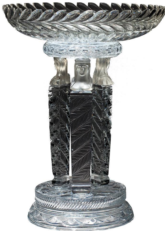
ВАЗА ДЕСЕРТНАЯ С ГОЛОВКАМИ КАРИАТИД ИЗ «ПРИГОРОДНОГО ГРАННОГО» СЕРВИЗА По проекту И.А. Иванова; скульптура – мастер Л.М. Карамышев 1823–1827 годы