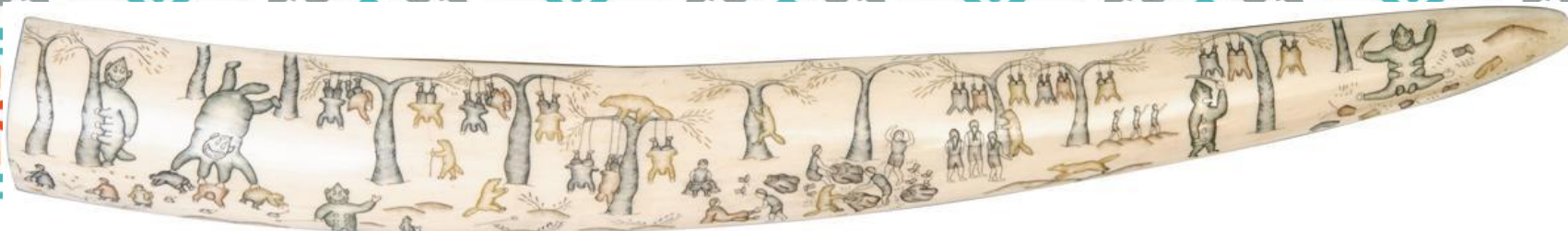
КЛЫК «СКАЗКА «КЕЛЕ И ДЕВУШКИ» , 1940-е гг., Чукотка, п. Уэлен