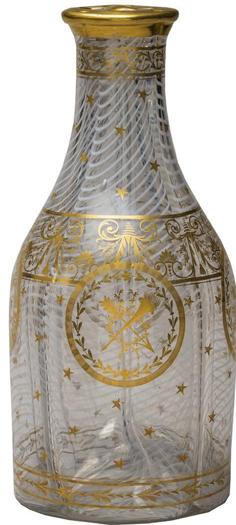
ГРАФИН ЧЕТЫРЕХЧАСТНЫЙ С ИЗОБРАЖЕНИЕМ ЛИРЫ Санкт-Петербург Императорский Стекланный завод, 1800-е годы