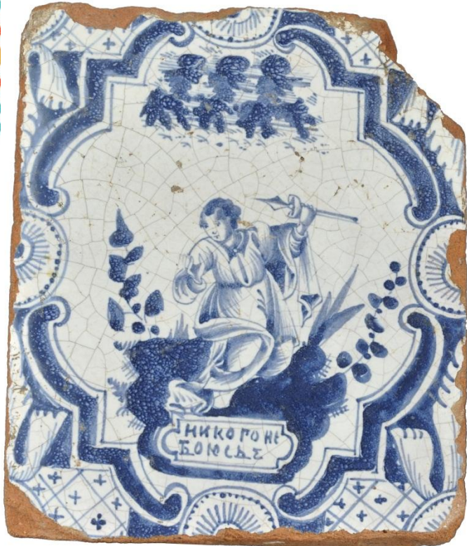
ИЗРАЕЦ ПЕЧНОЙ С НАДПИСЬЮ: «НИКОГО НЕ БОЮСЯ»