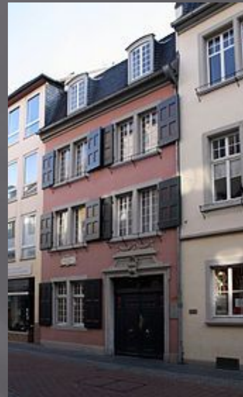
Дом, в котором родился Бетховен

Предположительно датой рождения считается 16 декабря 1770 г.