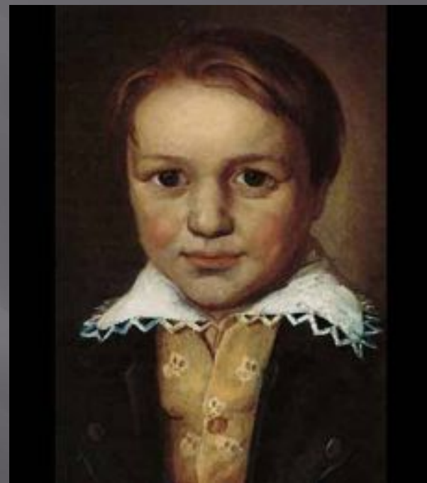
Портрет Бетховена в 13-летнем возрасте

Настоящим учителем Бетховена стал Кристиан Готлоб Нефе. Он познакомил Людвигу с творчеством Баха и Генделя. Благодаря Нефе, было издано и первое сочинение Бетховена — вариации на тему марша Дресслера. Бетховену в то время было двенадцать лет, и он уже работал помощником придворного органиста.