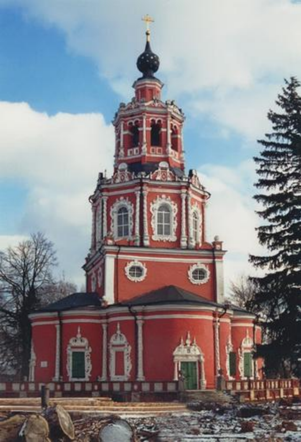
Церковь Спаса Нерукотворного в Уборах