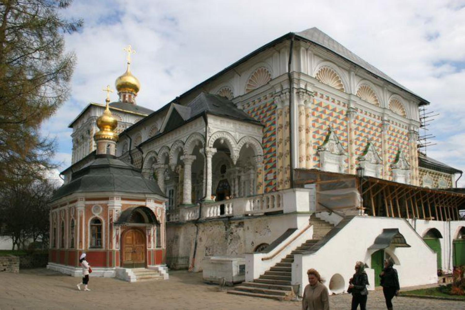
Трапезная Троице-Сергиевой лавры