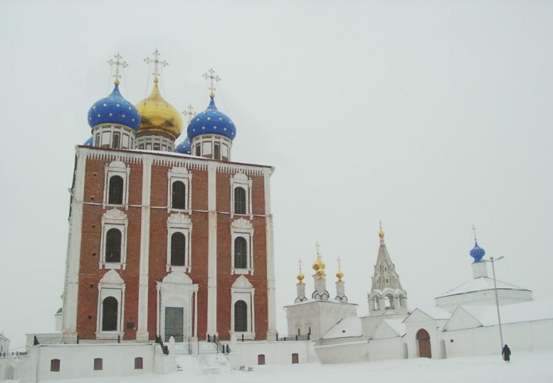
Храм Успения в Рязани