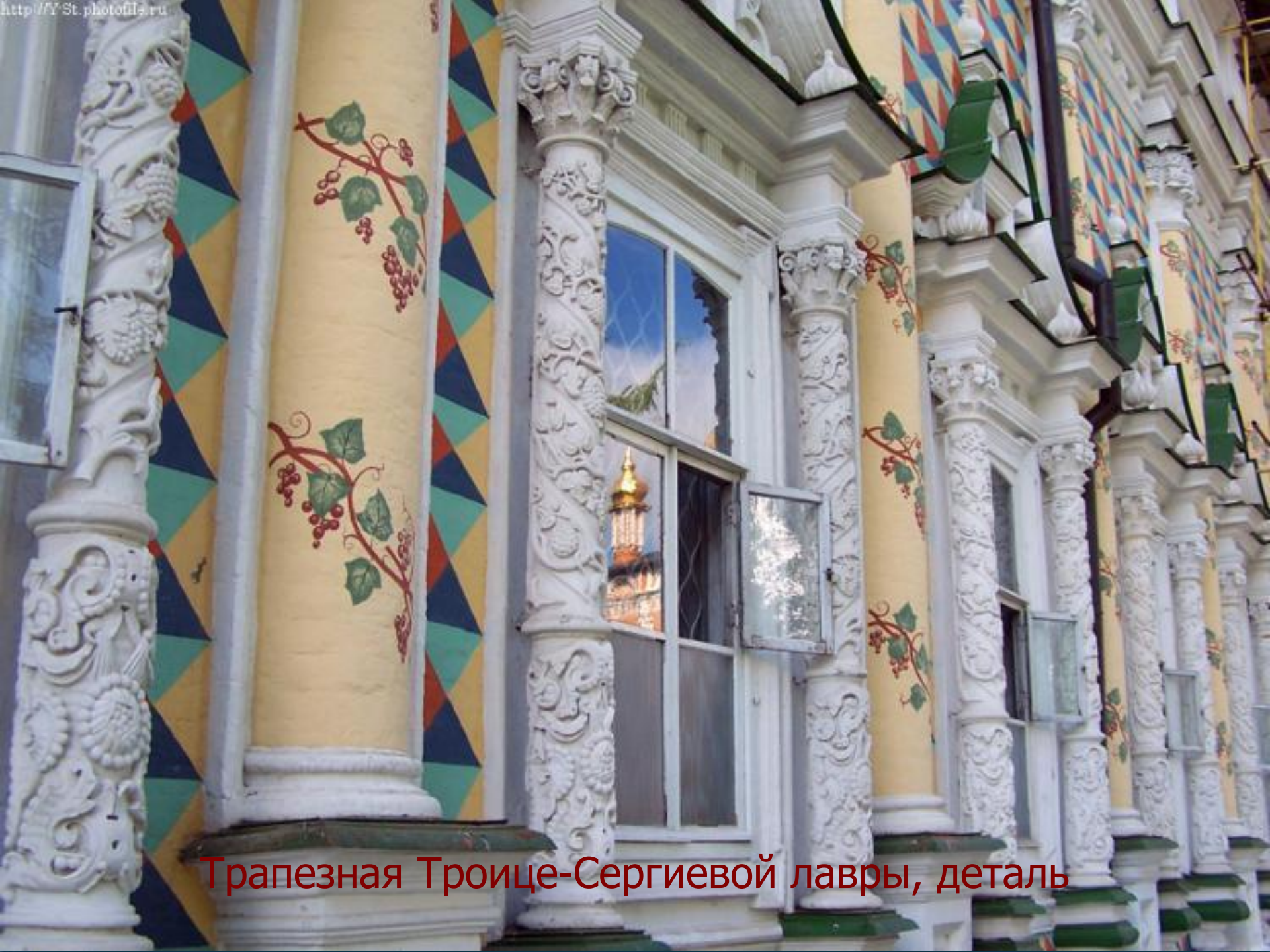
Трапезная Троице-Сергиевой лавры, деталь