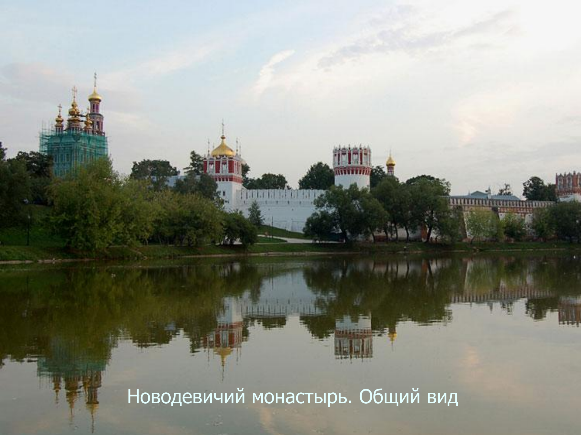
Новодевичий монастырь. Общий вид