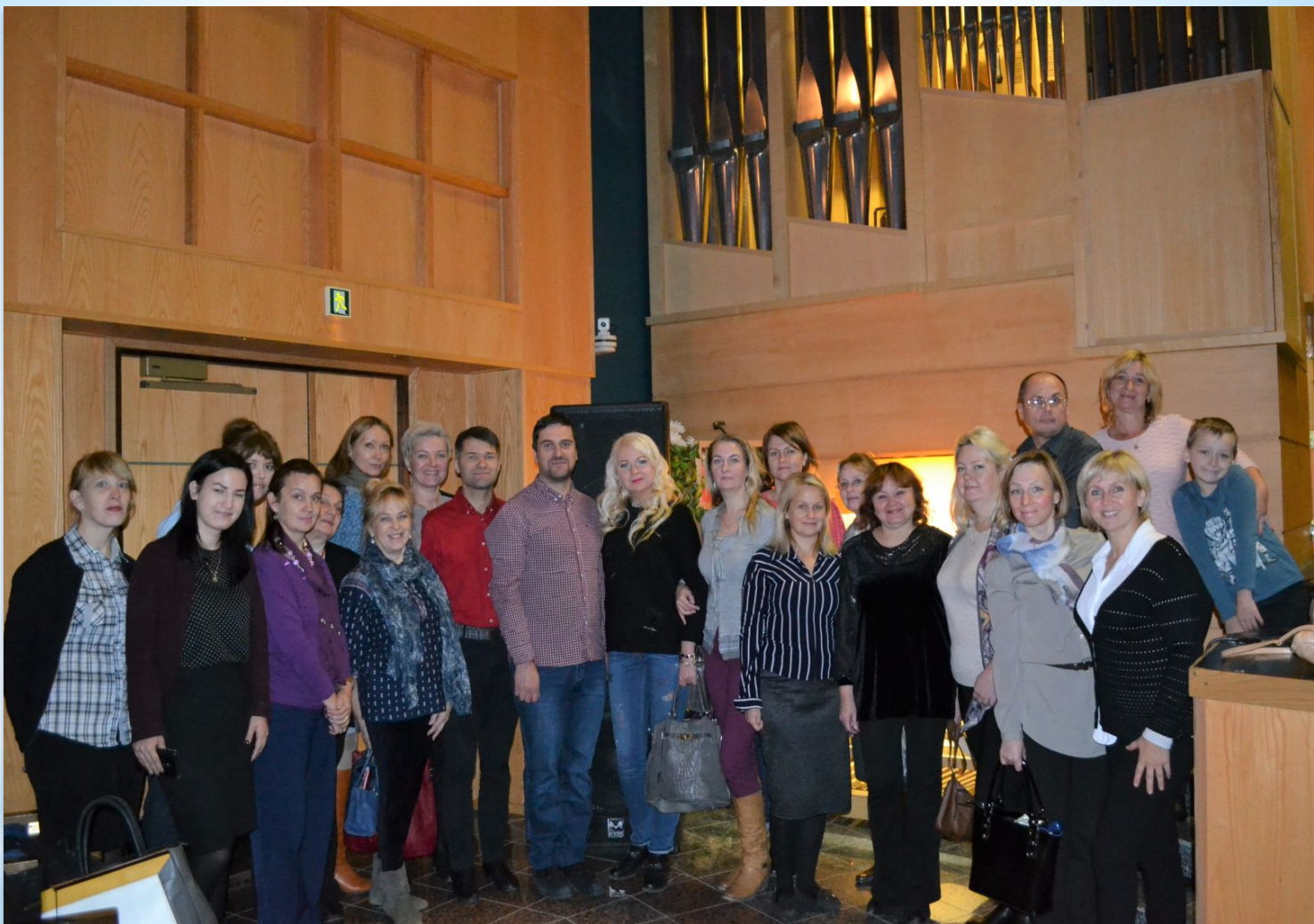
Поездка в Кондопогу 1 ноября