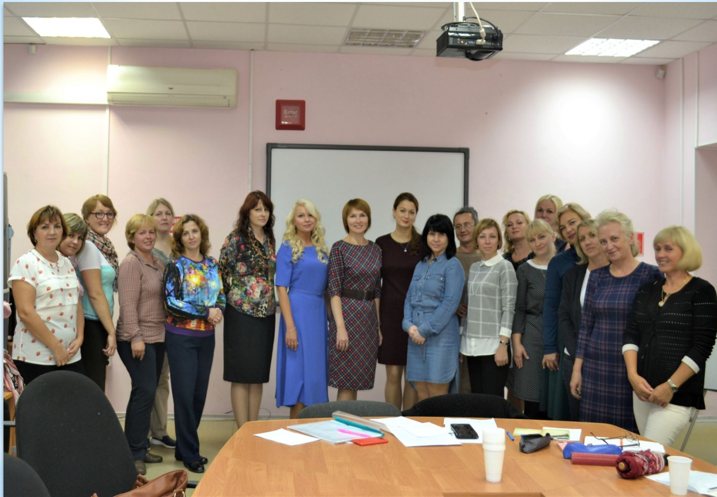
Первое заседание МО 12 сентября