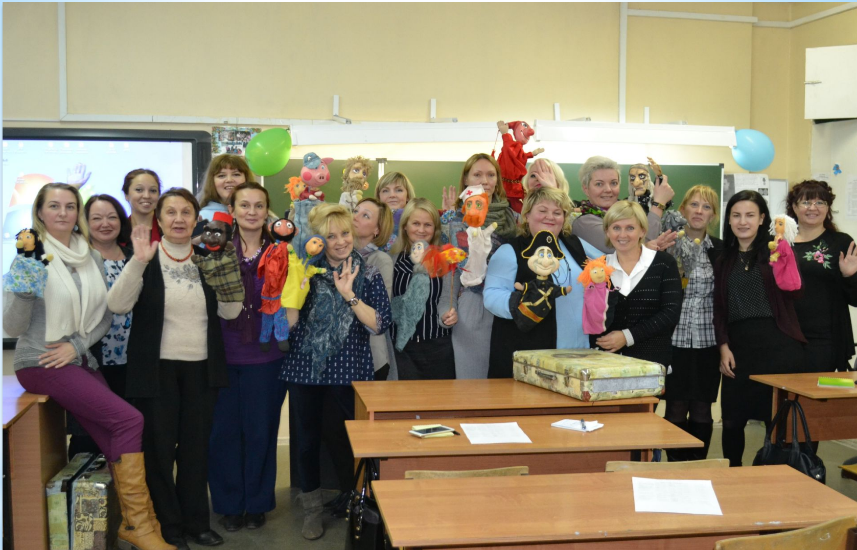
В школе № 8