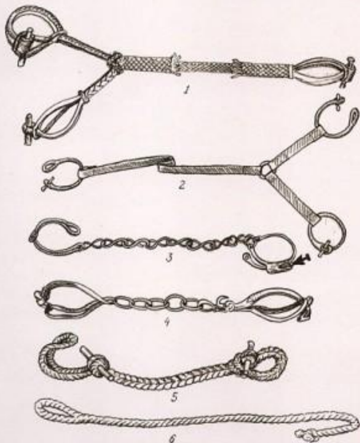
Кісендер мен тұсаудың түрлері