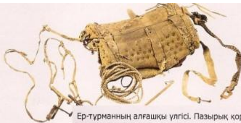
Ер-тұрманның алғашқы үлгісі. Пазырық қорғаны