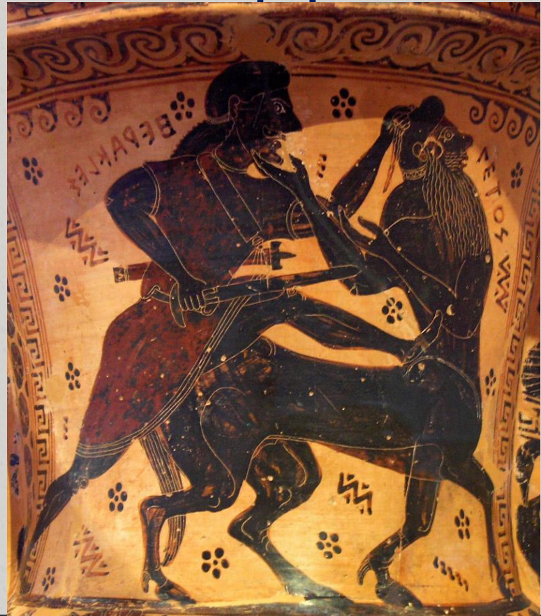
Чорнофігурна амфора із

Вазописець Несса. Колекція є однією з найбільших у світі, охоплюючи період з 11 століття до н. е. до романської епохи.