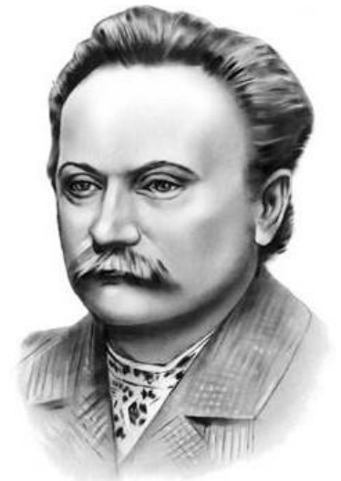
Іван Франко (1856—1916)