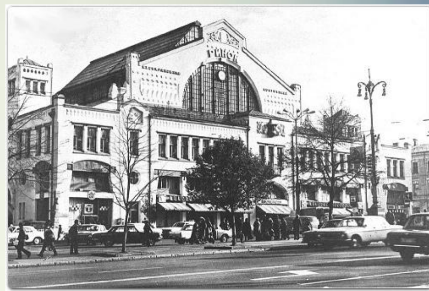
Бессарабський ринок, Київ