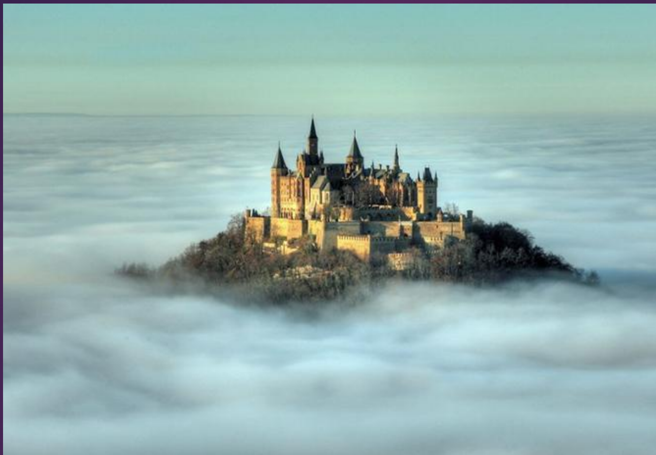
ЗАМОК ГОГЕНЦОЛЛЕРН, НІМЕЧЧИНА.