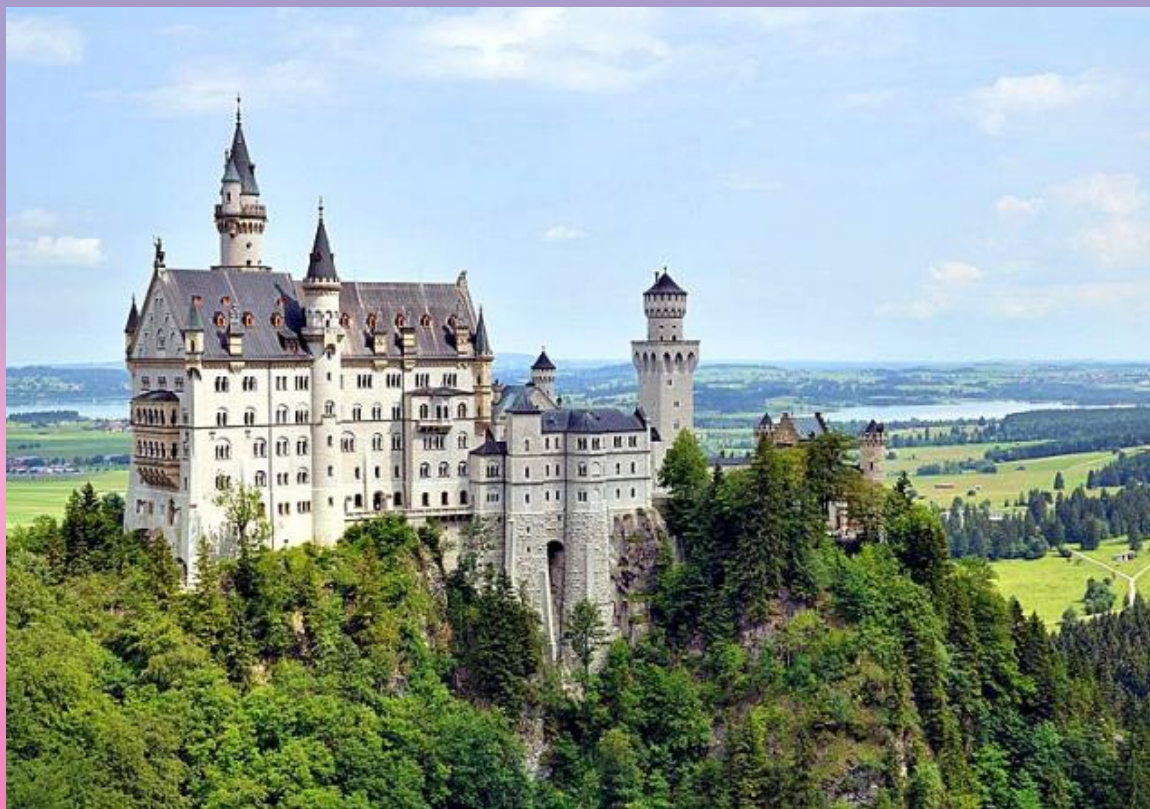
► Троско, Чехія