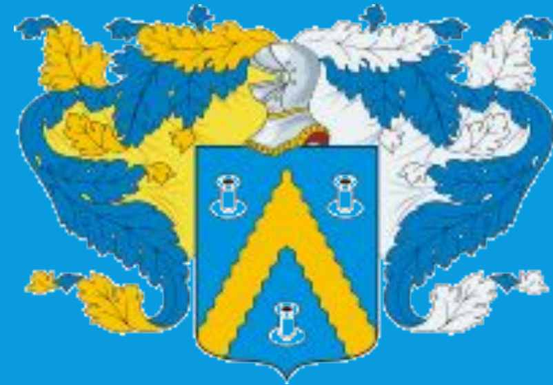
Герб Графов Милютиных

От его брата Андрея произошли в третьем поколении Владимир, Дмитрий и Николай Алексеевичи Милютины. Единственный сын графа Дмитрия Алексеевича, гр. Алексей Дмитриевич, генерал-майор и курский губернатор. Род Милютиных внесён в родословную книгу Московской губернии.