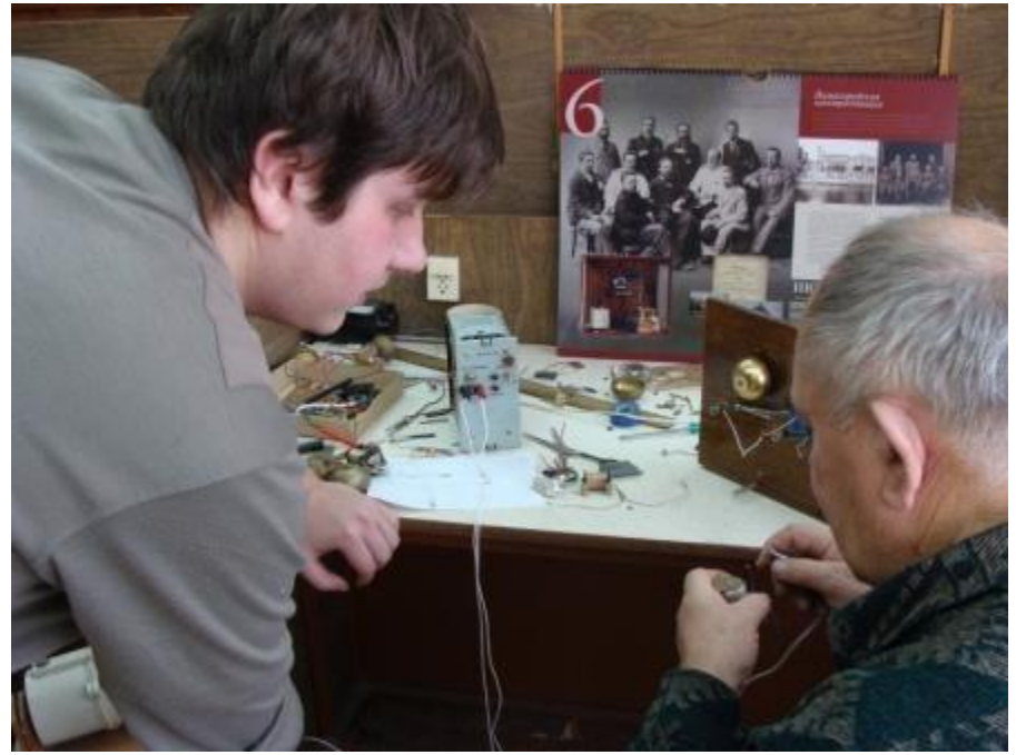
Сборка макета когерентного приемника