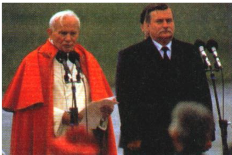
Лех Валенса и Иоан Павел II

В середине 1970-х гг. Польское руководство, Стремясь расплатиться с долгами Западу, усилило нажим на трудящихся. В ответ начались забастовки.