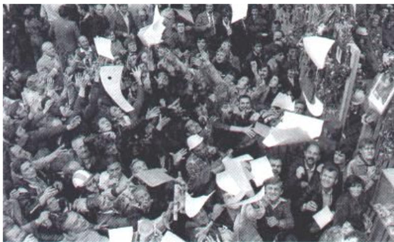
Митинг на верфи г. Гданьска. 1980 г.