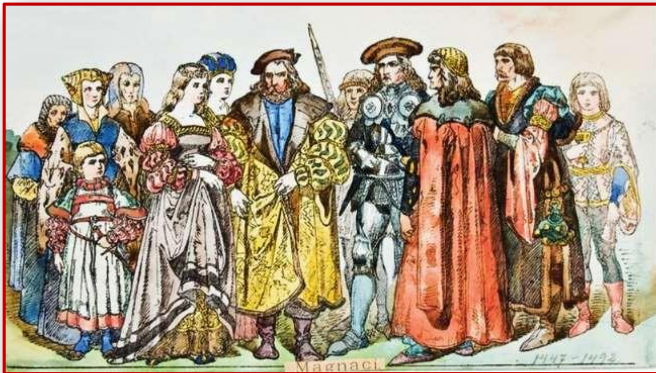
Аристократия ВКЛ XV в. Рисунок Яна Матейко

Ведущим и правящим сословием в ВКЛ являлись феодалы-владельцы земель-дельцы, в число которых входила шляхта. Она пользовалась исключительным правом на владение землёй и правом вершить суд над своими зависимыми крестьянами. Шляхетское звание передавалось по наследству, но его можно было и утратить, например, если шляхтич начинал заниматься ремеслом или торговлей.