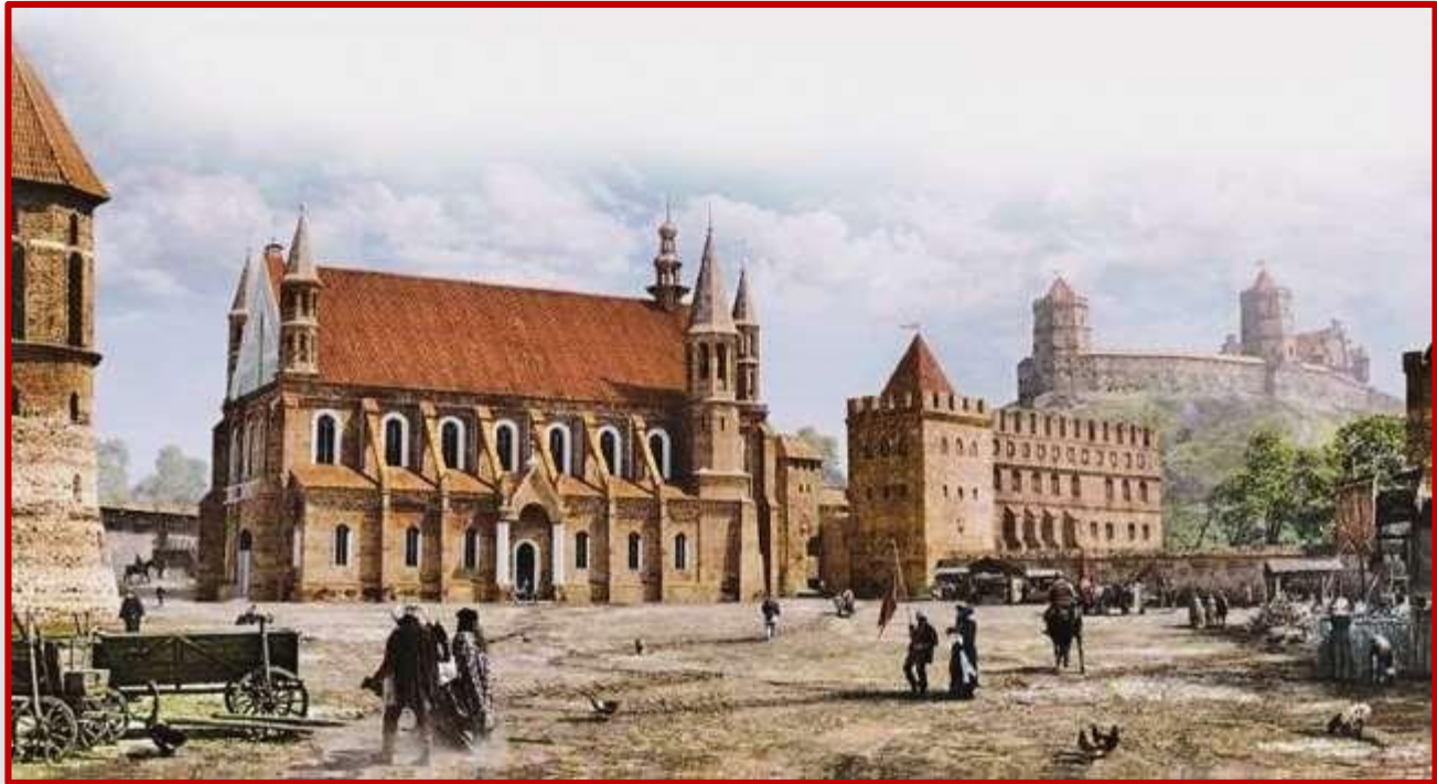
Вильно в начале XVI в. Реконструкция

Уже в XV в. центром города становится не замок, а торговая площадь, вокруг которой возникают посады - поселения ремесленников и торговцев. Коренных свободных горожан называли мещанами. Это название происходит от общеславянского слова «место» (город). Мещане владели имуществом, имели право передавать его по наследству.