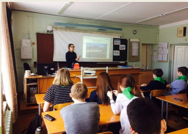
Мастер – класс «Экопакет своими руками»