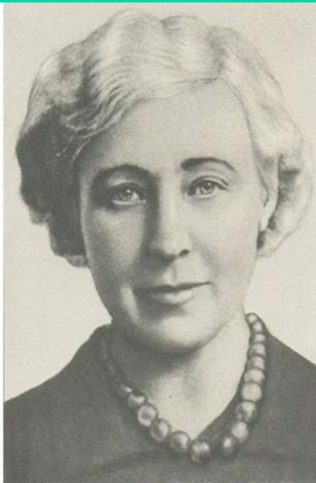
Марина Ивановна Цветаева. 1939г.