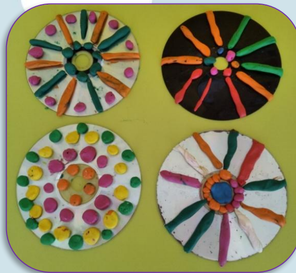
«Коврик для матрешки»