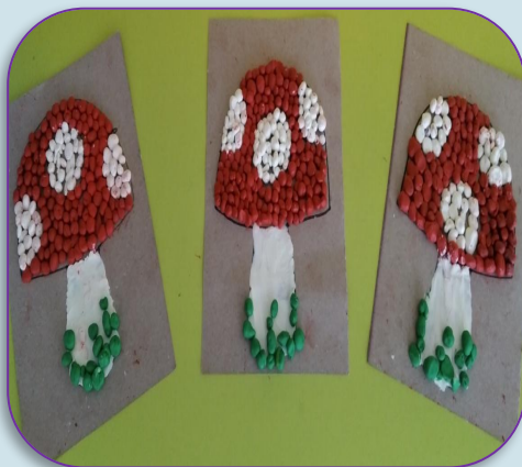
Коллективная работа «Грибы на поляне»