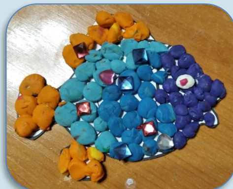
Мозаичная пластилинография «Рыбка»