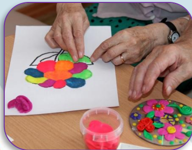
Мастер-класс «Пластилиновая страна»

Таким образом, родители чаще стали обращаться за советами по проблеме развития моторики детей, начали заниматься и играть со своими детьми в развивающие игры, рекомендованные воспитателем. Придя в детский сад после выходных дней, дети рассказывают о совместной деятельности с родителями, приносят интересные работы в технике пластилинография и с удовольствием показывают их.