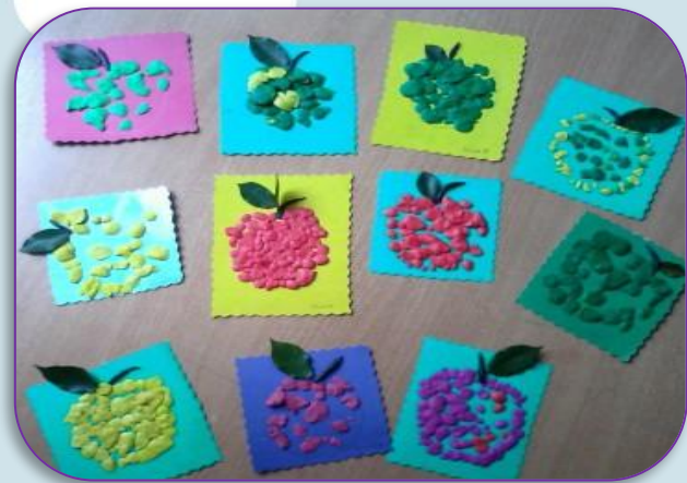
Выставка «Вкусные фрукты»