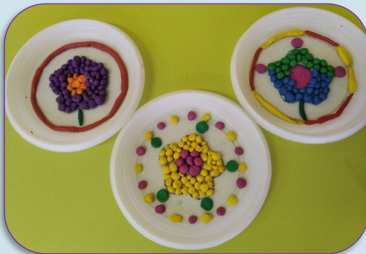
«У куклы Кати День рождения»