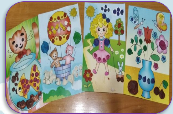
Мозаичная пластилинография «Раскрась картинку»