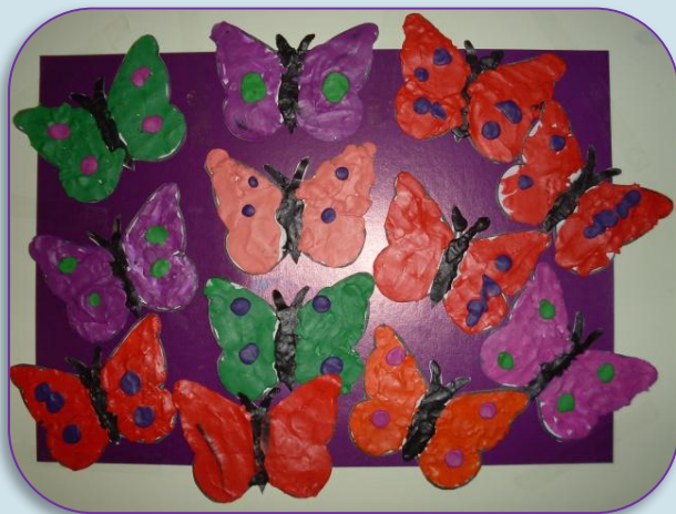
Выставка «Красивые бабочки»

Выполнив творческие работы, устраиваем вместе с ребятами в группе выставки. Дети рассматривают свои произведения, отмечают лучшие, рассказывают о сюжете, о том, какими приемами выполняли работу, какими инструментами и материалами пользовались, что использовали для украшения. Для анализа работ так же использовали пластилинового человечка, который давал свою оценку. Таким образом, ребята научились не только правильно выполнять задание, но и отслеживать результат.