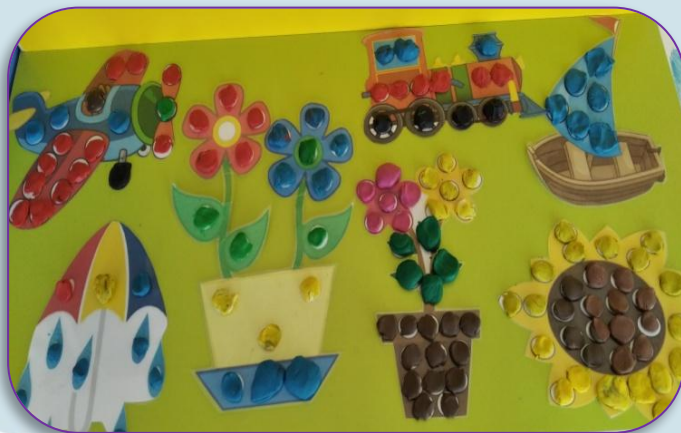
Дидактическая игра «Волшебные шарики»