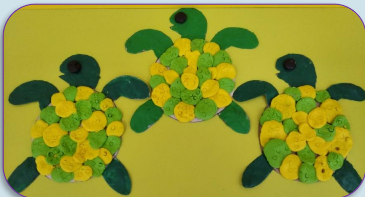
Модульная пластилинография «Черепашка»

На данном этапе дети научились выполнять работы по образцу и действовать по словесному указанию воспитателя.