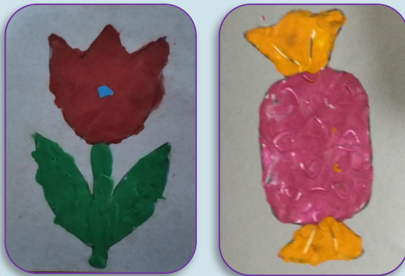
Прямая пластилинография «Конфета», «Цветок»