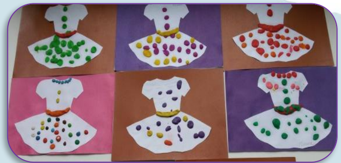
Мозаичная пластилинография «Украсим кукле платье»