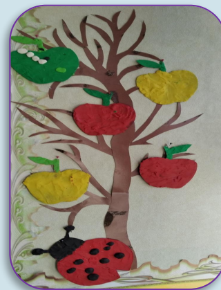
Коллективная работа «Яблоки на яблоне»