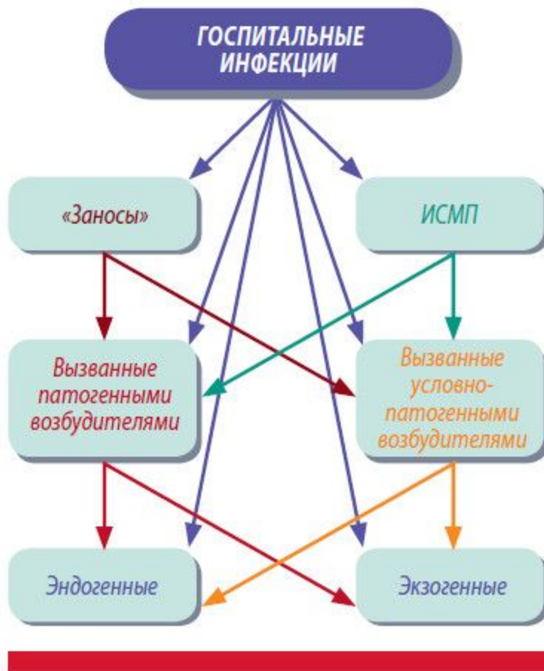
Рис. 1. Госпитальные инфекции