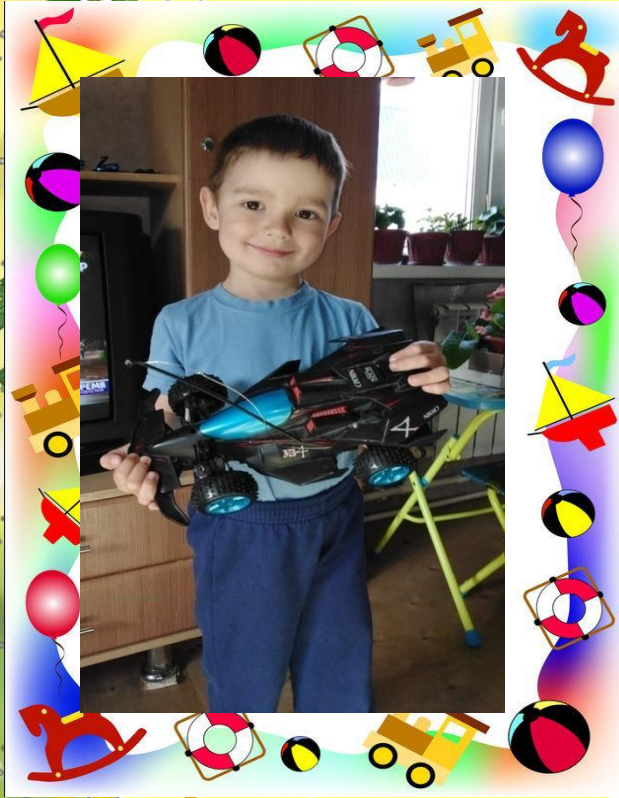
У меня гоночная машина!