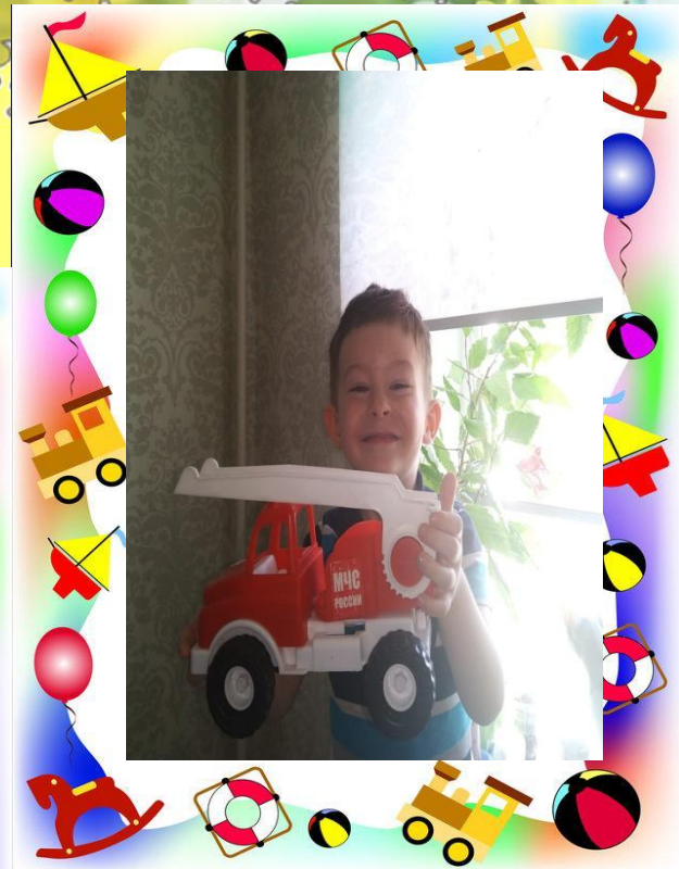
Ну как моя пожарная машина!