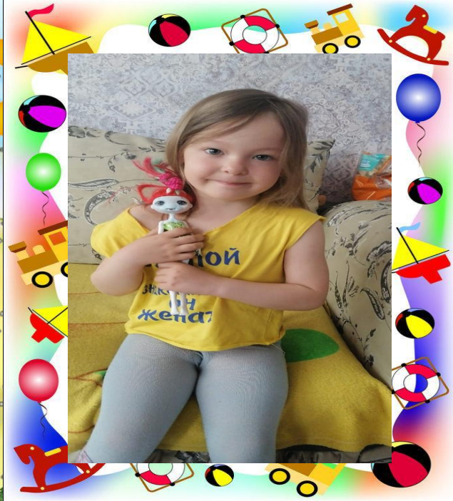
Самая любимая Единорожка!