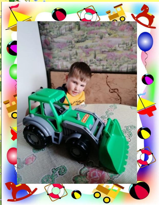
Мой трактор- бульдозер как настоящий