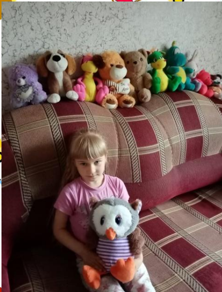
Очень любимые мягкие игрушки.