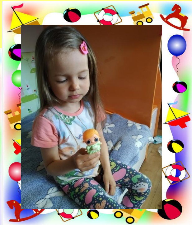
Моя любимая куколка Лол.