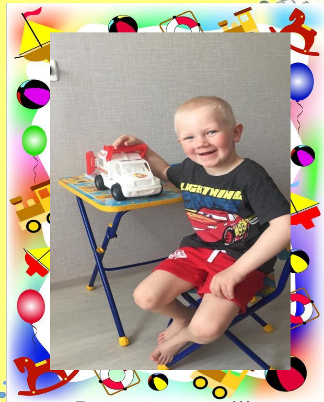
Вот моя машина!!!