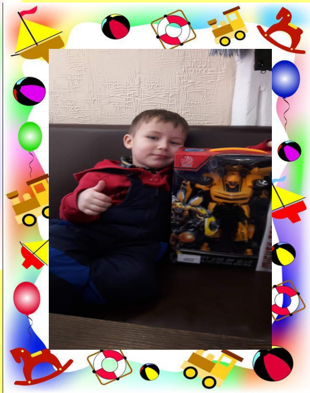
Вот игрушка у меня – робот трансформер