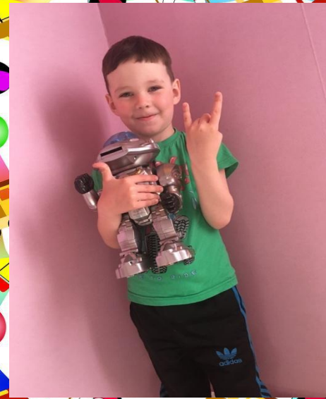
Любимая игрушка «Робот»