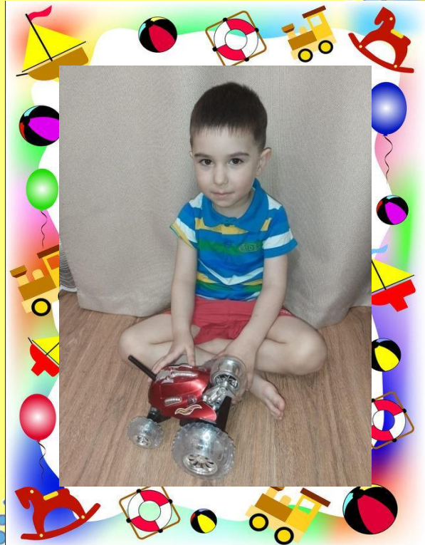
Моя очень любимая машина