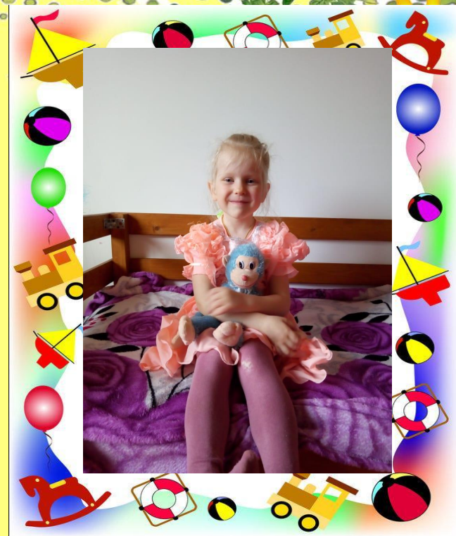
Моя мягкая игрушка