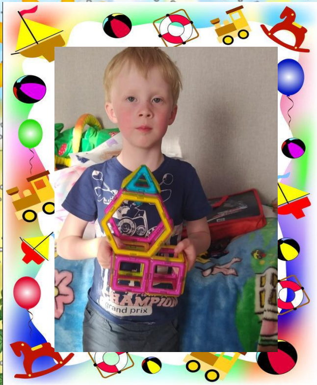
Моя игрушка - Магнитный конструктор