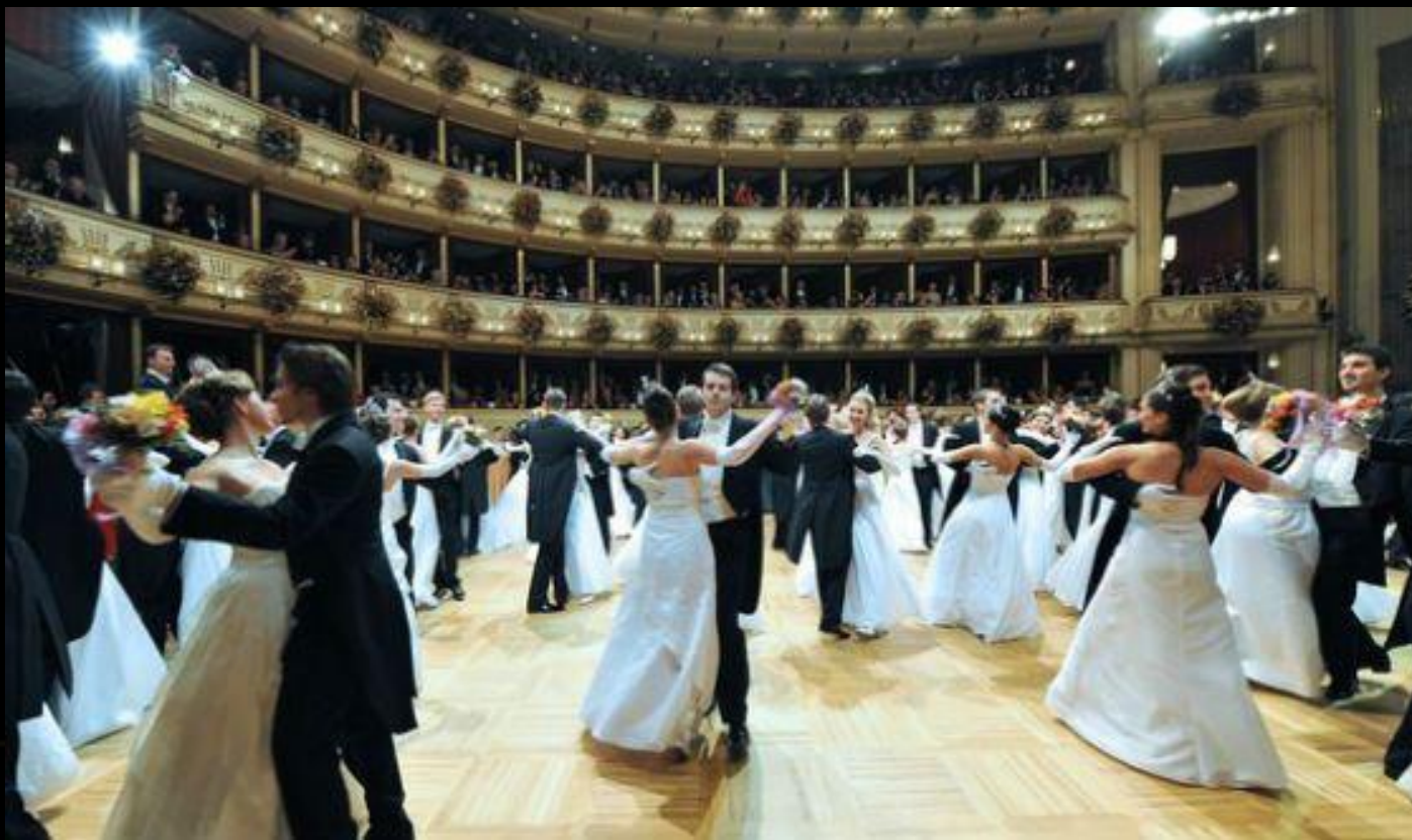
Венский бал – мероприятие со строгим дресс-кодом

Во Вторую мировую войну театр был частично разрушен, однако в 1955 году произошло его торжественное ре-открытие с оперой «Фиделио» Бетховена. По количеству представлений с Венской оперой не в состоянии сравниться ни один из других оперных театров. На протяжении 285 дней в году в этом здании на Рингштрассе ставится порядка 60 опер. Каждый год за неделю до первого дня Великого католического поста в здесь проходит Венский бал – мероприятие, занесенное в список нематериального культурного богатства, охраняемого ЮНЕСКО.