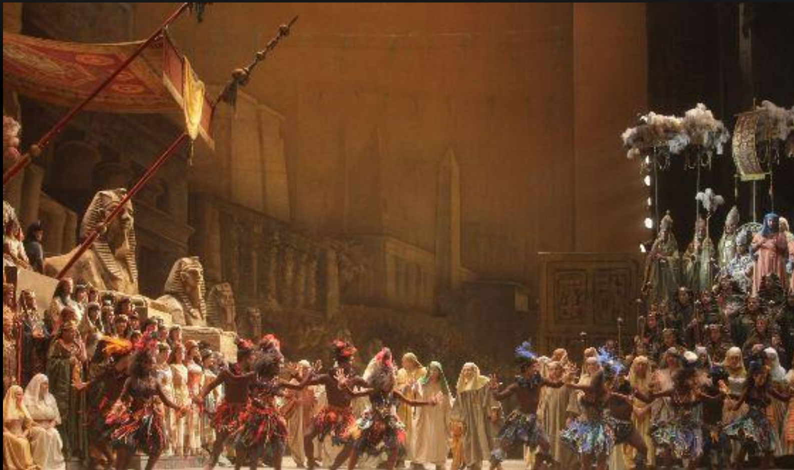
Фото сделано на опере «Аида» Джузеппе Верде

Сегодня Ла Скала по праву читается одним из самых известных театров мира. Это первое после Миланского собора, что осматривают прибывшие в Милан туристам.