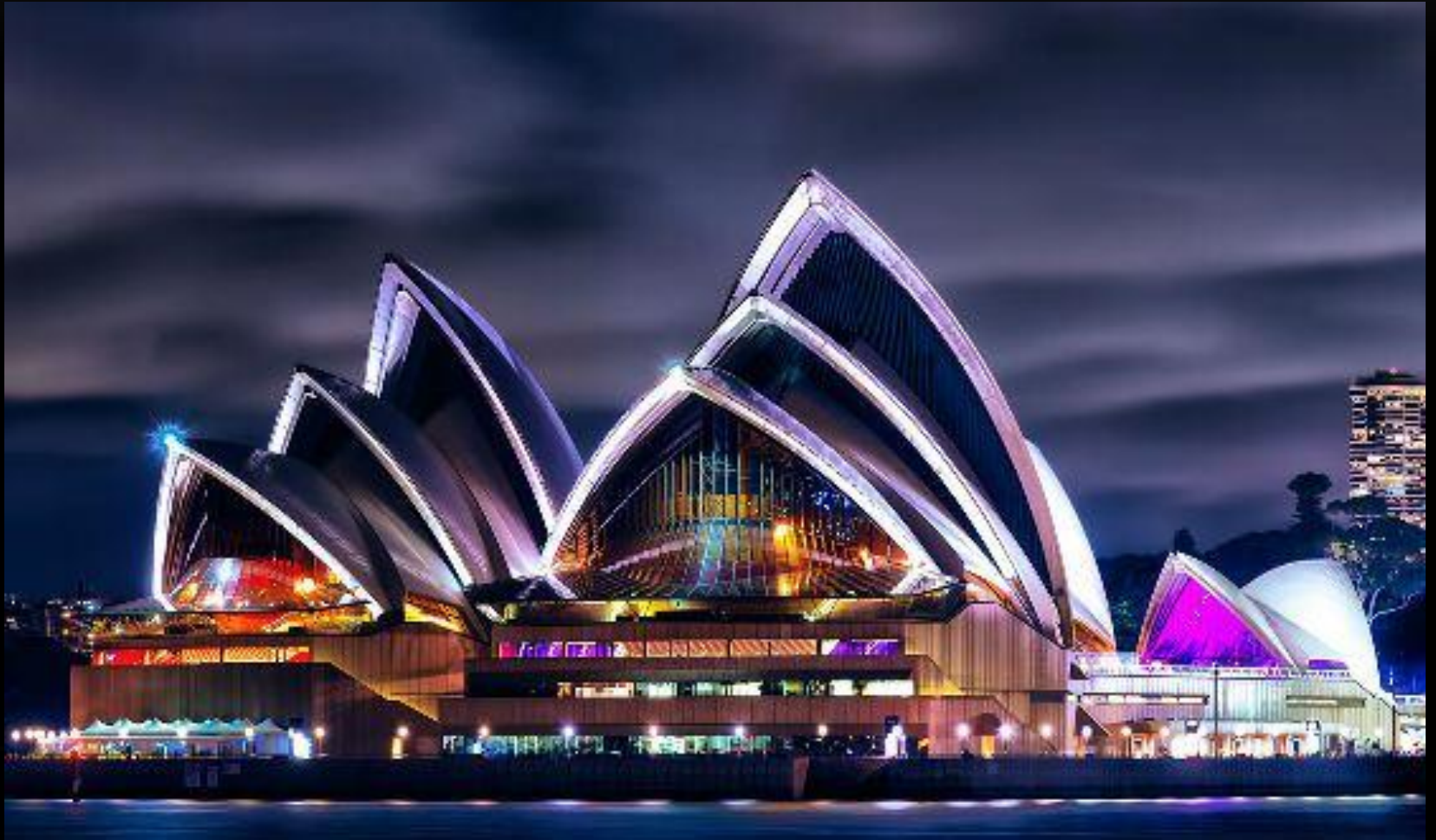
Сиднейский театр ночью

Общая площадь здания превышает два гектара. Внутри вы встретите без малого тысячу комнат, ведь здание является «штаб-квартирой» для Австралийской оперы, Сиднейского симфонического оркестра, Национального балета и Сиднейской театральной труппы.